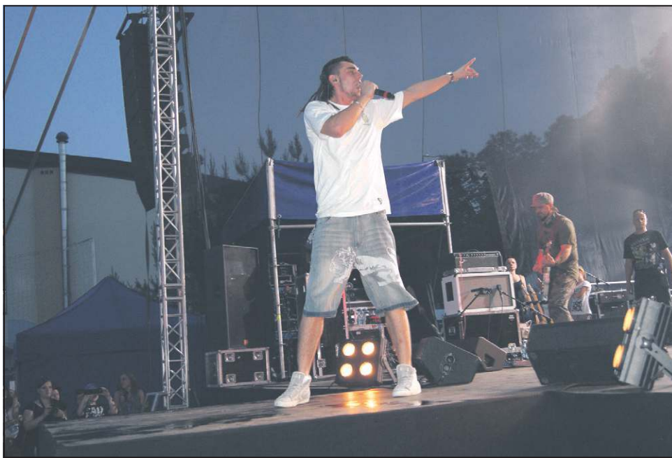
Kamil Bednarek podczas koncertu na Dniach Sochaczewa

■ Tłumy przyciągnęły jednak wielkie imprezy odbywające się na placach i ulicach miasta. Takim szczególnym wydarzeniem są oczywiście Dni Socha-