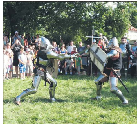
Pokaz średniowiecznych walk rycerskich