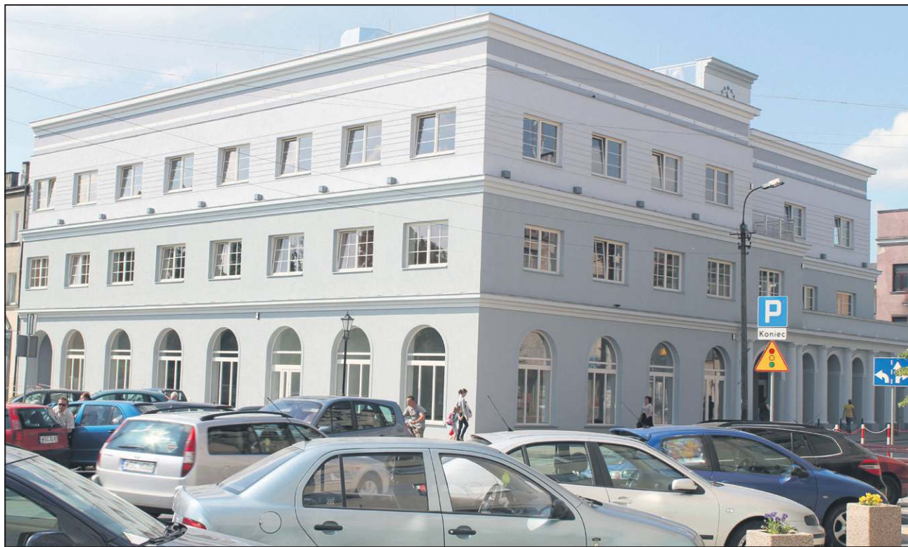
Z całą pewnością jednym z najważniejszych wydarzeń roku 2013 było otwarcie kramnic. Ich remont i rozbudowa kosztowały 9 mln zł

● 25 stycznia rada jednogłośnie zdecydowała o rozszerzeniu katalogu zniżek, z jakich mogą korzystać posiadacze Sochaczewskiej Karty Rodziny, wydawanej rodzicom wychowującym co najmniej troje dzieci. Burmistrz zaproponował, by mogły one z 50% zniżką kupować jednorazowe bilety na basen (dotychczas bo-