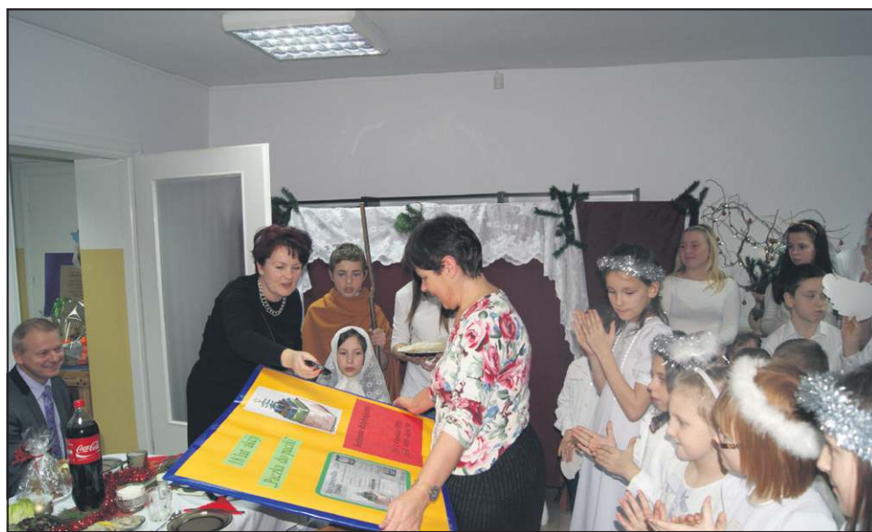
Redakcja „ZS” otrzymała olbrzymią laurkę z symbolicznym dowodem osobistym