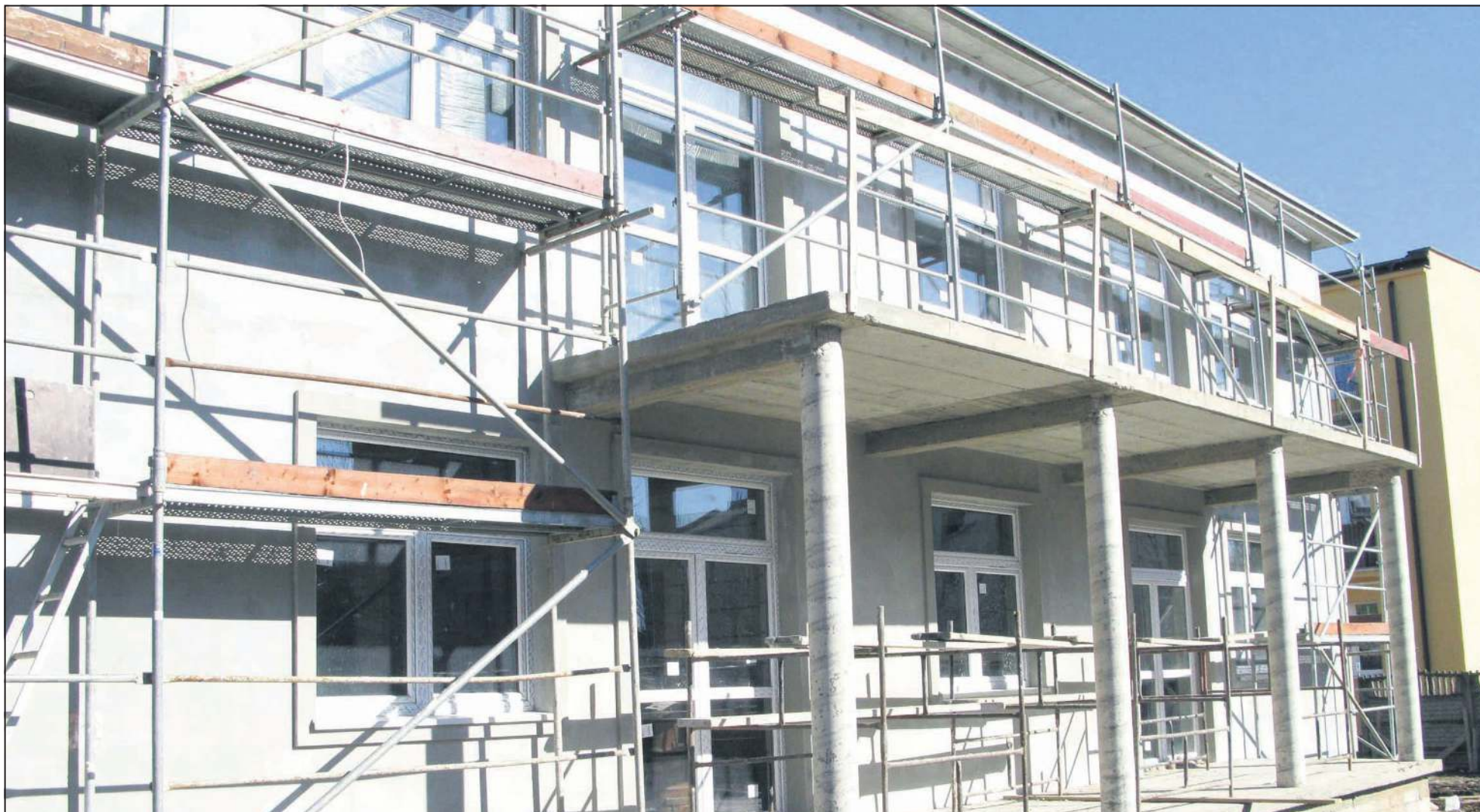
Przez cały 2013 rok trwała budowa nowego miejskiego żłobka. Niebawem odbędzie się uroczyste otwarcie placówki, w której znajdzie się około 100 miejsc dla najmłodszych sochaczewian

● Hala sportowa przy Szkole Podstawowej nr 4 rośnie w oczach. W połowie października rozpoczął się montaż konstrukcji, na której oparty zostanie dach. Ekipy spieszą się, by przed zimą wykonać jak najwięcej prac.