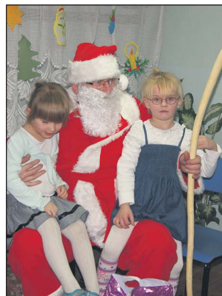
Św. Mikołaj odwiedził m.in. ognisko TPD w Chodakowie

cji z kwitkiem. Dla rodziców odwiedzających nas w tym czasie bardzo przy-