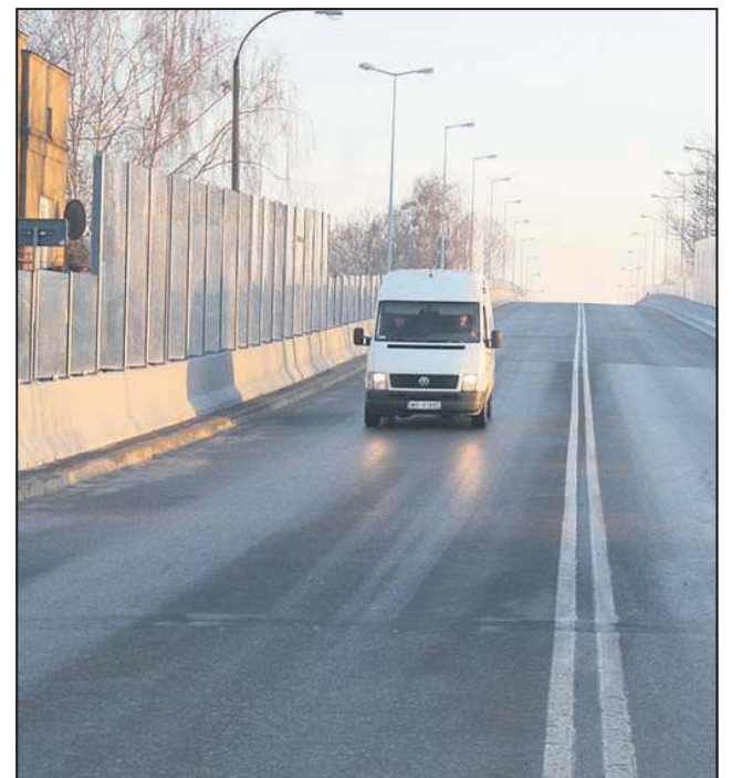
Na gwiazdkę dostaliśmy w prezencie wyremontowany wiadukt