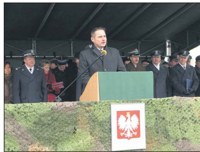
W lutym witaliśmy w Sochaczewie 3 Brygadę Obrony Rakietowej