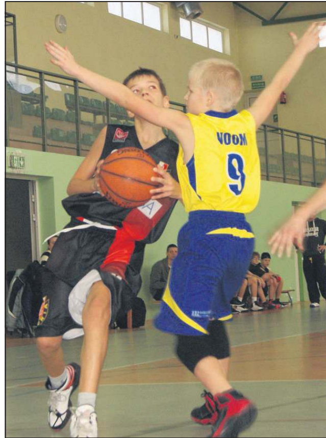
Młodzi walczyli bardzo ambitnie (Atoria - KK Hito)