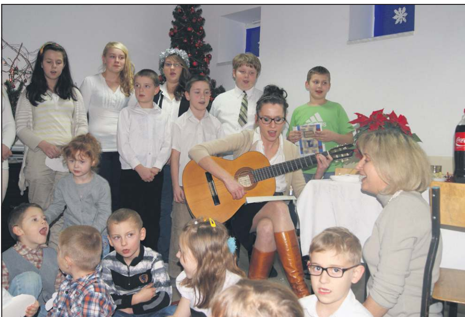
Jasełka w Ognisku Wychowawczym TPD w Trojanowie

W paczkach znalazły się m.in.: płatki do mleka, kakao rozpuszczalne, litrowy karton soku, chrupki podarowane przez firmę Mardol, wyroby czekoladowe z Mars Polska, kruche ciasteczka, czekolada, słone paluszki. Dodatkowo każde dziecko dostało upominek w postaci gry, książki, maskotki, piórnika, płynu do kąpieli, czy puzzli. Do świetlic trafiło 140 paczek. Pozostałe 220 otrzymały dzieci z niezamożnych rodzin zgłoszonych do redakcji. Aby zaspokoić wszystkie potrzeby, musieliśmy dokupić artykułów spożywczych. Ostatnie paczki (dla osób z listy rezerwowej) nie były też tak okazałe. Ważne jednak, że nikt nie odszedł z redak-