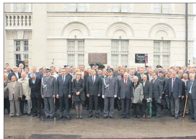
W maju świętowaliśmy 50-lecie 32 Pułku Lotnictwa Rozpozn. Takt.