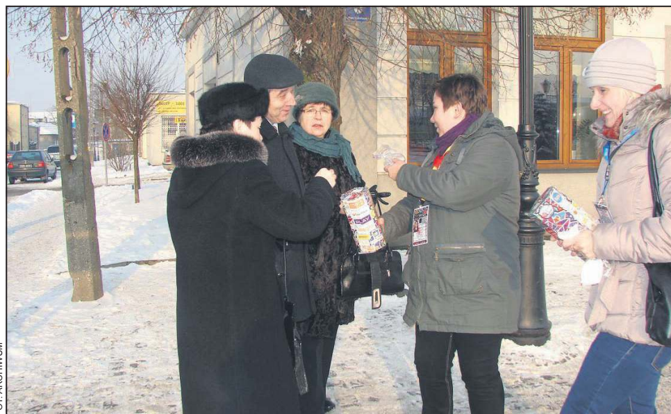
Organizatorzy WOŚP jak zawsze liczą na otwarte serca mieszkańców

W tym roku do świątecznej pomocy przystąpiła również pełniąca rolę nieformalnego ośrodka kultury, znana wszystkim ze swej działalności „Pełna Qlturka” z ul. Żeromskiego. Zarówno w sobotę jak i w niedzielę odbędą się tu koncerty, podczas których usłyszymy znane kapele. W sobotę o godz. 18.00 wystartuje Skibob, o 19.00 zagra Alligator, a o 20.00 Mech. Niedzielne granie o 14.30 rozpocznie Tajm, o 16.00 zaprezentuje się Awrock, o 17.00 zwycięzca ubiegłorocznej Veny, czyli Pacierz, później, o 18.00,