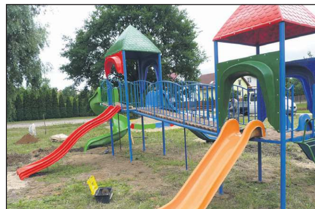
W lipcu oddano do użytku nowy plac zabaw w Karwowie