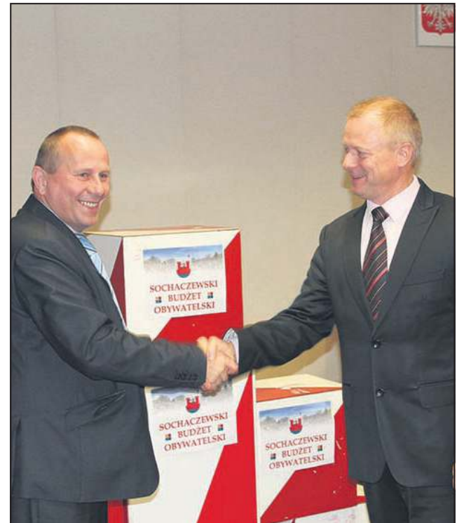
Sochaczewski Budżet Obywatelski okazał się wielkim sukcesem

● Tuż przed świętami Bożego Narodzenia Mazowiecki Zarząd Dróg Wojewódzkich oddał do użytku remontowany od Wielkanocy wiadukt na ul. Żyrardowskiej. (dw)