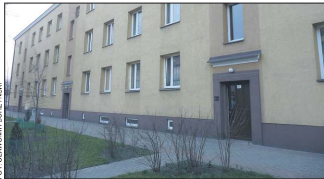
WEJŚCIE DO KLATKI SCHODOWEJ BLOKU, W KTÓREJ ZNALEZIANO PObITEGO DENATA