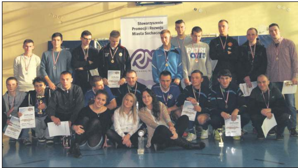
Medaliści turnieju wraz z organizatorkami imprezy