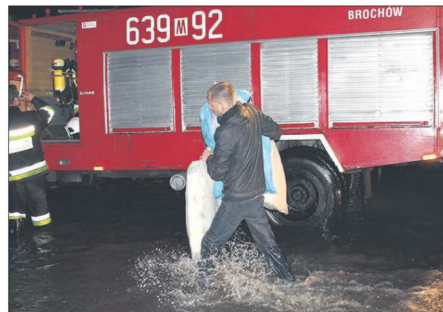
A w czerwcu nad miastem przeszła gigantyczna nawałnica