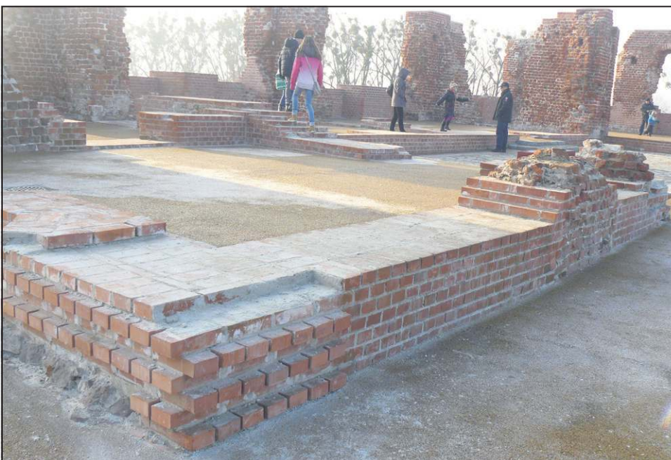
Wchodzenie na zrekonstruowane mury na pewno nie poprawia ich stanu

- Użyta zaprawa sporządzona została zgodnie z historycznymi wytycznymi. Podobną stosuje się w ponad 90 procent rekonstrukcji obiektów w Polsce. Z zasady nie jest ona tak trwała jak współczesne. Chodzi o to, by