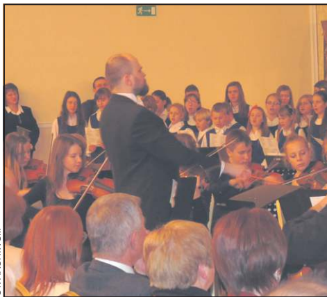
Ostatni koncert z cyklu „Spotkania z Chopinem”