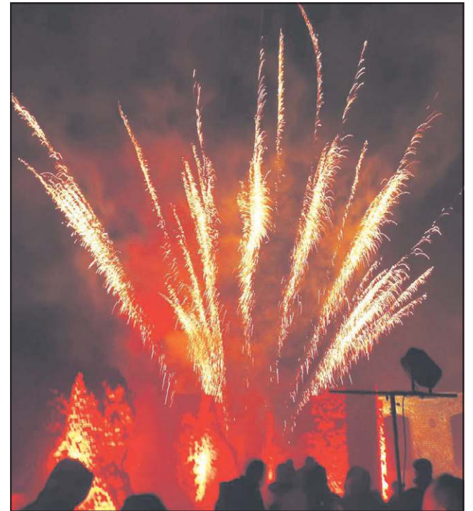
Rewitalizacja wzgórza zamkowego to wydarzenie historyczne