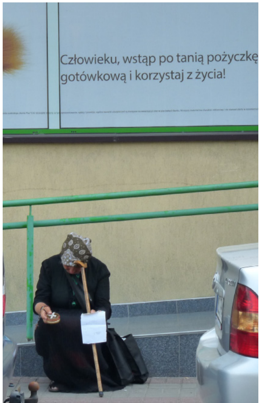
C'est la vie...

● Generał Wojciech Jaruzelski obchodził 90. urodziny. Na bankiecie z tej okazji, w jednym z warszawskich hoteli, pojawili się m.in. Jerzy Urban i Aleksander Kwaśniewski. Był też reżyser Kazimierz Kutz. Może zamierza nakręcić nową wersję swego przeboju sprzed lat „Paciorki jednego różańca II”.