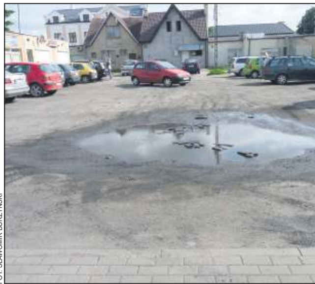
Wyboje i kałuże odstraszały klientów