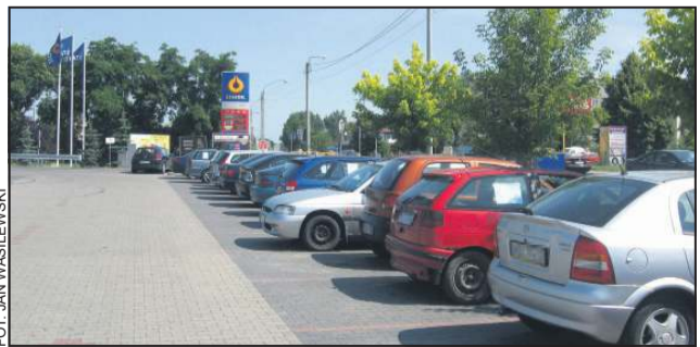
Stojące rzędem auta są na sprzedaż

Od dłuższego już czasu, parking ten służy jako komis samochodowy. Stoją na nim auta różnych marek, nie tylko z naszego regionu. Na samochodach są rejestracje z Warszawy, Krakowa, czy nawet pojazdy na duńskich numerach.