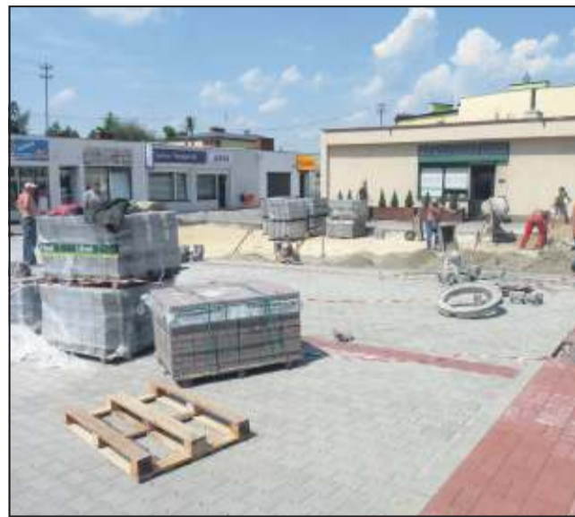
Ułożenie kostki ma być początkiem zmian na Kościuszki bis

Doszło w końcu do tego, iż niemal wszyscy zgodnie wyłonili wykonawcę. Gdy przyszło do podpisywania