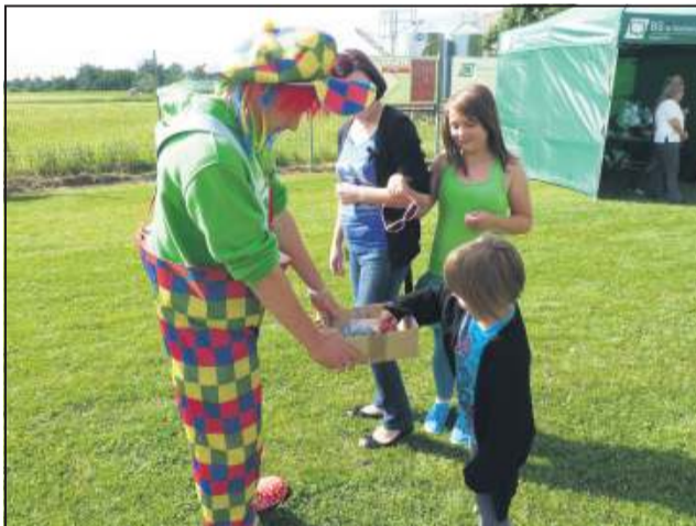
Dzieci cieszyły się z rozdawanych przez klaunów słodyczy