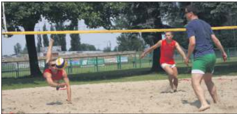
W meczach na piasku nie brakuje efektownych akcji

Drugi turniej Grand Prix Sochaczewa w siatkówce plażowej odbył się w środę (3.07).