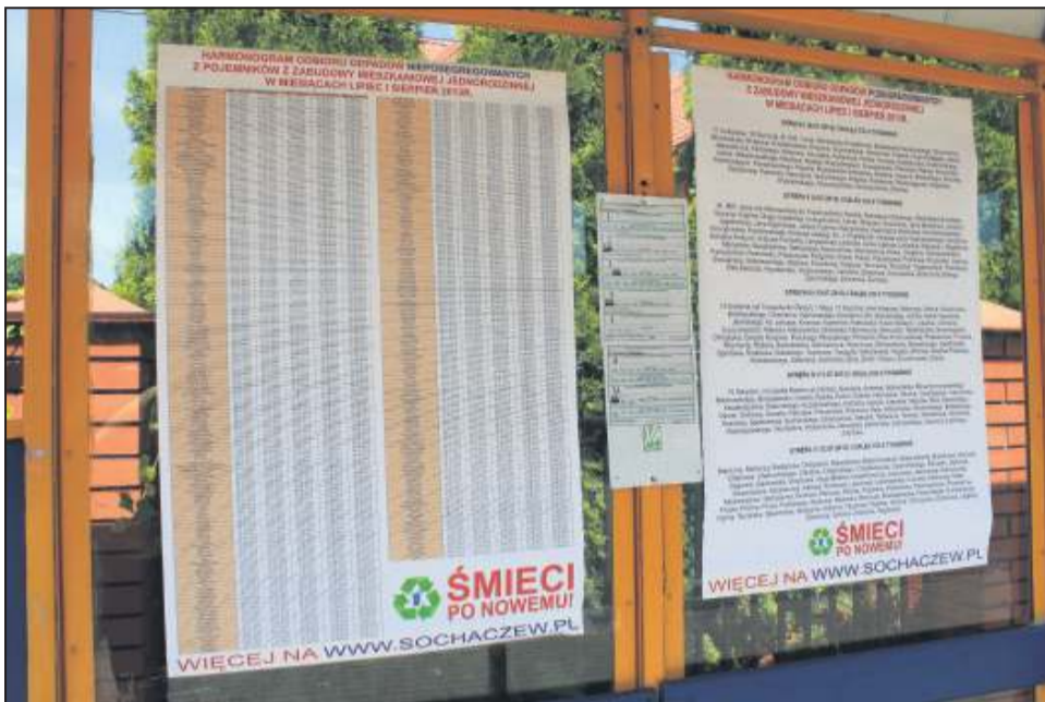
Na terenie miasta pojawiły się plakaty z harmonogramem odbioru śmieci

W blokach śmieci będziemy segregować na szkło, papier, plastik, metale i opakowania wielomateriałowe (tzw. tetra paki, czyli mówiąc najprościej opakowania po sokach, czy mleku). Tak po-