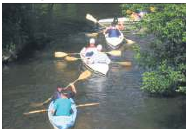
Takie wyprawy cieszą się dużym powodzeniem

Tym razem, mamy nadzieję ku zadowoleniu wszystkich, zdecydowaliśmy się zmienić trasę. Wystartujemy od kościoła w Boryszewie i spłyniemy aż do Przystani w Plecewicach. Taka trasa pozwoli zapoznać się uczestnikom spływu z widokami Sochaczewa widzianymi z perspektywy rzeki Bzury. Czas wyprawy szacujemy na około 2,5-3h.