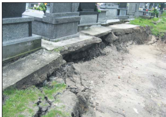
Wojewoda oglądał również zniszczenia na cmentarzu przy ulicy Traugutta

- Warto dodać, że cały czas pracujemy nad usuwaniem skutków i przyczyn podtopień. Wiele prac zostało już wykonanych. Często drobnych, których nie widać, ale które pomagają. Przecież ulew od czwartego czerwca przeszło nad miastem kilka. Odbudowujemy przepusty pod drogami, przepychamy zapchane kolektory burzowe, jak trzeba wymieniamy na nowe - jak było przy ul. Piłsudskiego. Czasem wystarczy, że zostanie podniesiony krawężnik, czy przebudowany wlot do spustu burzowego. Trwa oczywiście zlecona przez miasto inwentaryzacja wszystkich urządzeń wodnych i melioracyjnych. Do końca sierpnia powinniśmy mieć gotową dokumentację dla terenów w Chodakowie, które najbardziej ucier-