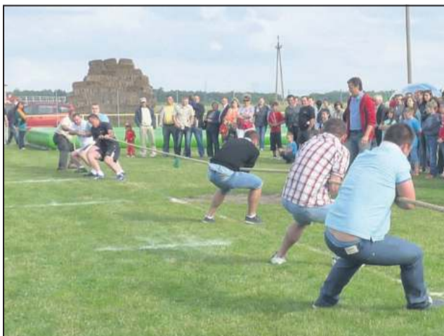
Przeciąganie liny to zawsze kluczowy punkt festynu