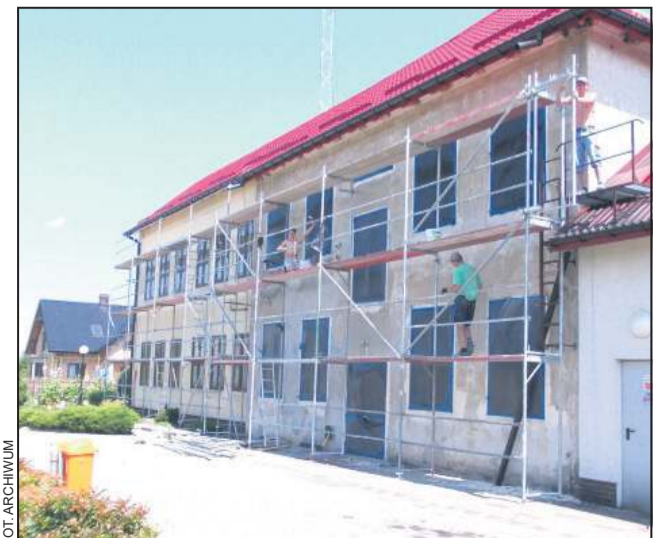
Prace na fasadzie szkoły ruszyły pełną parą