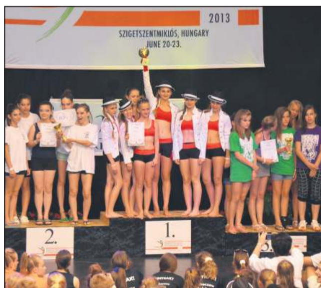
Radość z zajęcia najwyższego stopnia podium

- Wyjechaliśmy 19 czerwca nocą. Podróż była