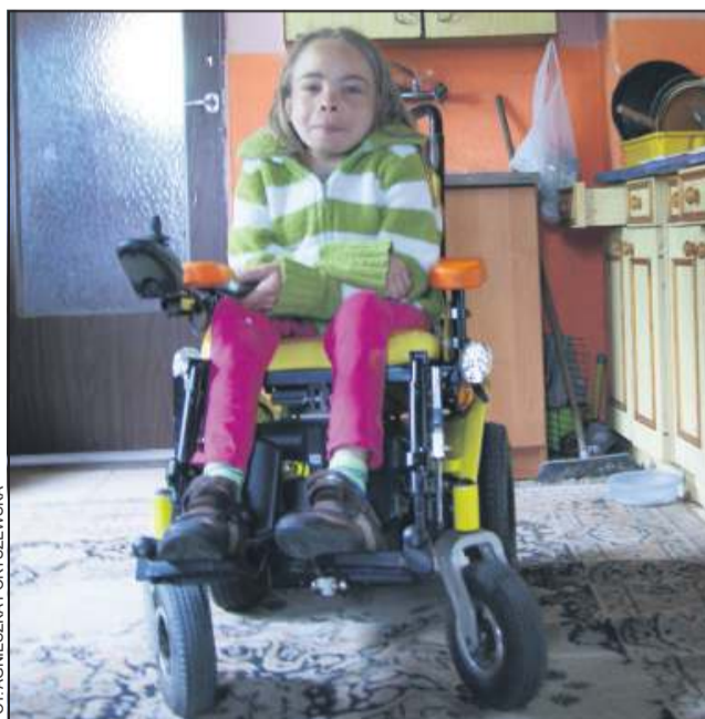
Ania otrzymała już część najpotrzebniejszych sprzętów

Pierwsze, doraźne wsparcie zorganizowała redakcja „Ziemi Sochaczewskiej” wraz z przyjaciół-