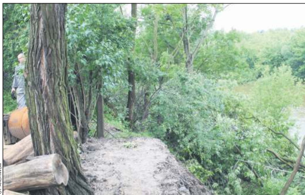
W miejscach osuwisk prowadzone będą specjalistyczne badania geologiczne

- Przy okazji chciałbym podkreślić ogromne zaangażowanie i rolę, jaką praktycznie od pierwszego dnia po nawałnicach odgrywa dyrektor wydziału bezpieczeństwa i zarządzania kry-