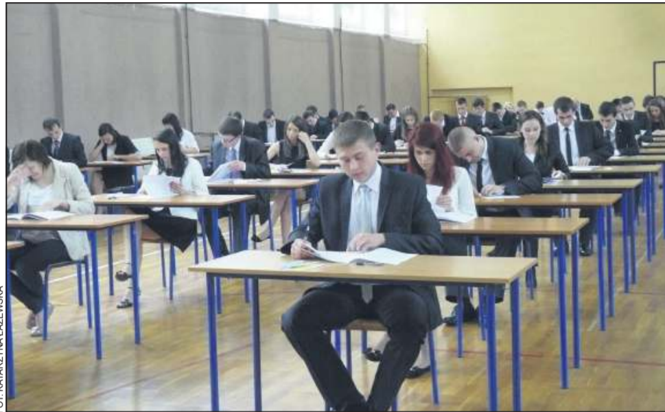
W ubiegłym tygodniu absolwenci otrzymali wyniki egzaminu maturalnego

Najwięcej, bo ponad 200, pisało maturę w Zespole Szkół Rolnicze Centrum Kształcenia Ustawicznego , czyli w „ogrodniku”. 133 osoby przystąpiły do egzaminów w liceum, z czego pomyślnie zdało 86,5 procent, w technikum zaś na 73 abiturientów świadectwo maturalne otrzyma 63 proc.