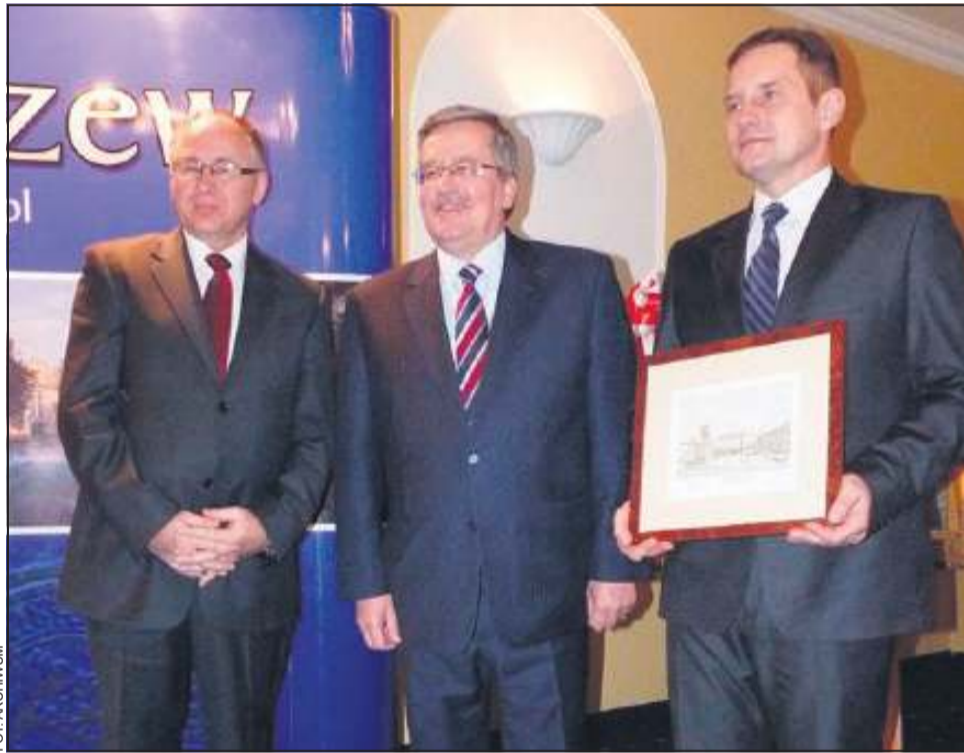
Jednym z najważniejszych wydarzeń ubiegłego roku była wizyta Prezydenta RP Bronisława Komorowskiego

■ Od 2011 roku dzierżawcą miejskiego targowiska przestał być KS Orkan, a zarząd nad rynkiem powierzono Miejskiemu Ośrodkowi Sportu i Rekreacji. Dochody z dzierżawy MOSiR przeznacza na swą działalność, tj. na sport, utrzymanie obiektów użyczanych klubom i UKS-om za darmo.