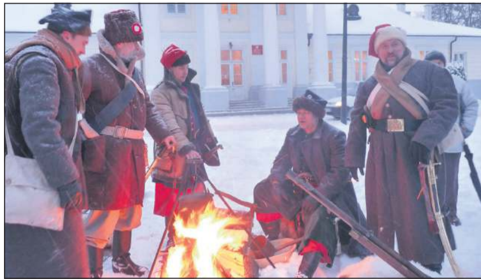
Duże zainteresowanie wzbudził rozstawiony w parku Garbolewskich obóz powstańców

Ci sami „powstańcy” ze Stowarzyszenia Historyczno-Edukacyjnego im. 7 Pułku Lansjerów Nadwiślańskich rozstawili w zasypnym śniegiem parku Garbolewskich powstańczy obóz. Wzbudzał on spore zainteresowanie przechodniów i spacerowiczów i był niewątpliwie atrakcją dla przybywających na patriotyczny koncert gości. Oni też mogli podziwiać, przed salą koncertową, kilkuplanszową zapowiedź przygoto-