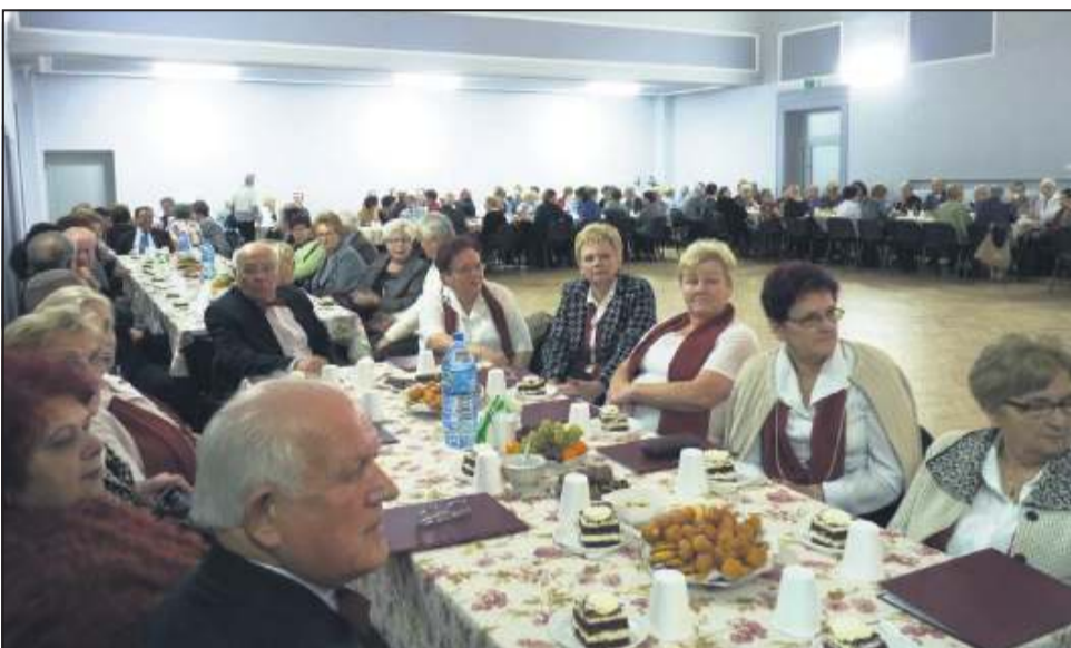
Osoby po 65 roku życia będą się mogły ubiegać o Kartę Seniora

- Do programu Sochaczewska Karta Rodziny przystąpiły też prywatne