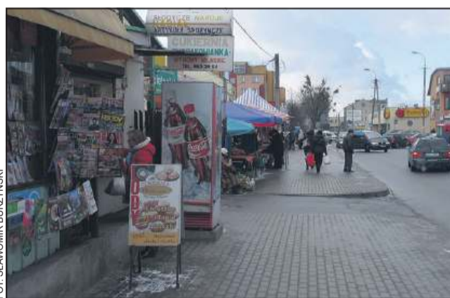
Chodnik przy ul. Pokoju przyjazny spacerowiczom

Ostatnio swoje żale zgłosili do naszej redakcji niektórzy handlujący na terenie targowicy, i to zarówno z części spożywczej jak i przemysłowej, przypominając, że już wcześniej władze miasta zgodziły się na handel zajmujący nie więcej niż metr szerokości chodnika. Jednak prawie nikt tego nie przestrzegał i w efekcie przepis pozostał zu-