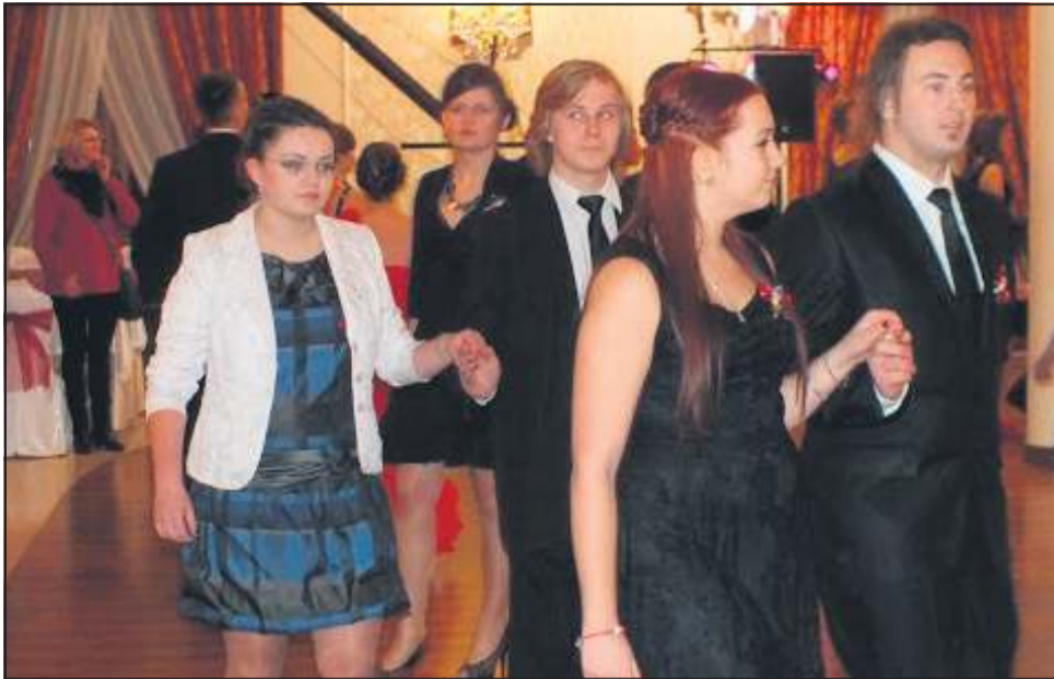
Licealiści „Ogrodnika” rozpoczęli sezon na studniówce

Bawili się przy muzyce zespołu Sabat, a hitem wieczoru był utwór „Ona tańczy dla mnie” zespołu Weekend. Uczniowie technikum z „ogrodnika” studniówkę odbyli tydzień później 19 stycznia w zajeździe „Na Rozdrożu” w Nieborowie. Tej samej soboty w dworku „Magnat” bawiła się młodzież z Zespołu Szkół im. Jarosława