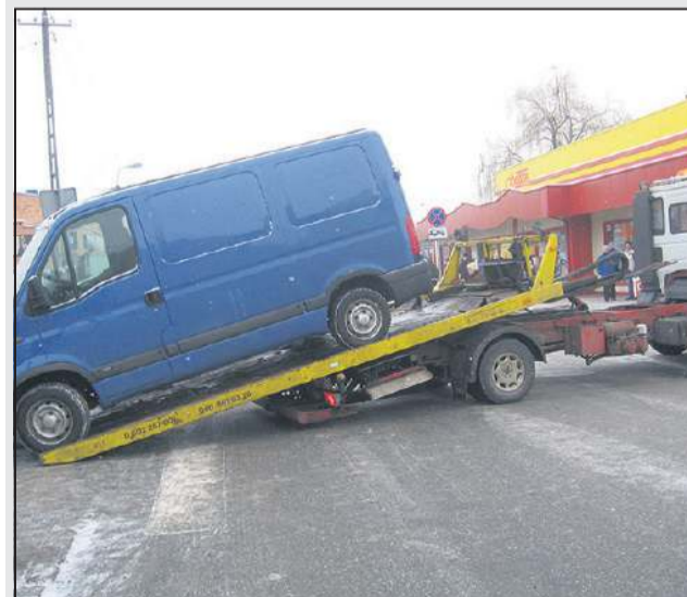
Właściciel pojazdu słono zapłacił za transport na policyjny parking

Dyżurny jednostki otrzymał informację, że mężczyzna w stanie upojenia alkoholowego leży na chodniku. Funkcjonariusze na miejscu zastali 59-letniego mieszkańca Teresina. W związku z tym, iż mężczyzna znajdował się w okolicznościach zagrażających jego życiu i zdrowiu, osadzono go w policyjnym areszcie do wytrzeźwienia.