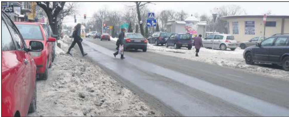
Jest duża szansa na remont ul. Staszica

- Miasto zapewnia na tę powiatową inwestycję ze swojego budżetu aż 1 124 948 złotych. Z kolei powiat ma w budżecie 449 980 zł własnych środków na ten remont - przy-