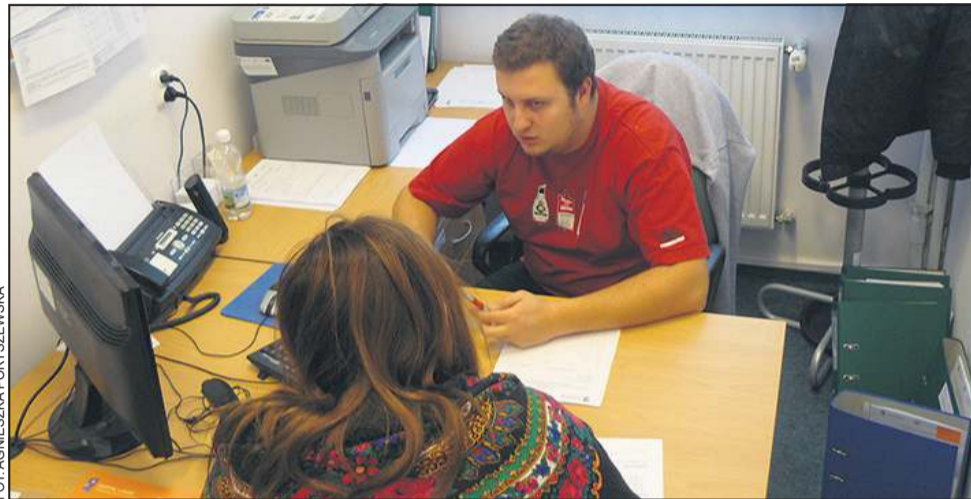
W MCK do każdej osoby podchodzi się indywidualnie

Z kolei Młodzieżowe Centrum Karier zajmuje się prowadzeniem zajęć indywidualnych i grupowych z dziedziny szeroko pojętego poradnictwa zawodowego, udziela informacji o możliwościach kształcenia, szkoleniach, poszukiwanych