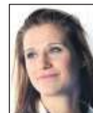
Natalia Partyka Zawodniczka Sochaczewskiego Klubu Tenisa Stołowego. Olimpijka i mistrzyni paraolimpiady.