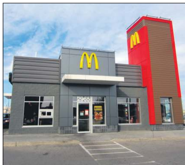
Jedna z takich restauracji już niedługo pojawi się w Sochaczewie

* Najpóźniej na czerwiec tego roku zaplanowano otwarcie Mc Donald's w Wójtówce. Inwestor otrzymał już pozwolenie na budowę. Będzie to pierwsza taka restauracja w naszym powiecie. Już niebawem sąsiadować ma nie tylko z Obi i Carrefourem, ale także z Tesco oraz galerią handlową.