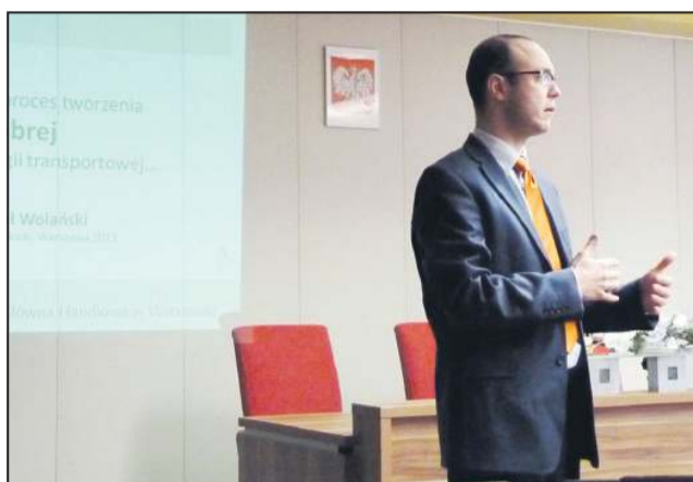
Ekspert pomagał samorządowcom wybrać najlepszą opcję

Burmistrz wyraził nadzieję, że po tym spotkaniu, w ciągu kilku kolejnych dni, wskazane zostaną konkretne projekty i inwestycje, które miasto, powiat