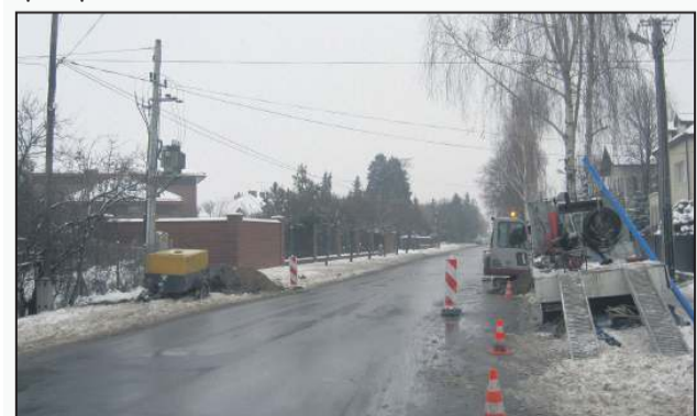
Prace przy ulicy 15 Sierpnia przyniosą oszczędność prądu

Oprócz wymiany słupów na ulicy 15 Sierpnia, przestawiono transformator stojący przy kościele w Boryszewie i wykonano niezbędne przyłącza. (jw)