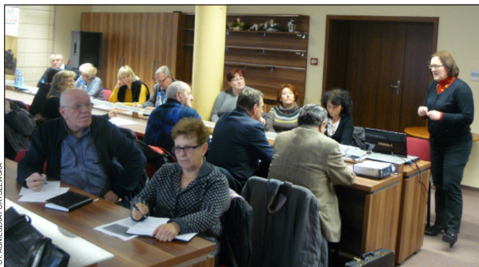
Ustawa śmieciowa wciąż pozostawia wiele pytań