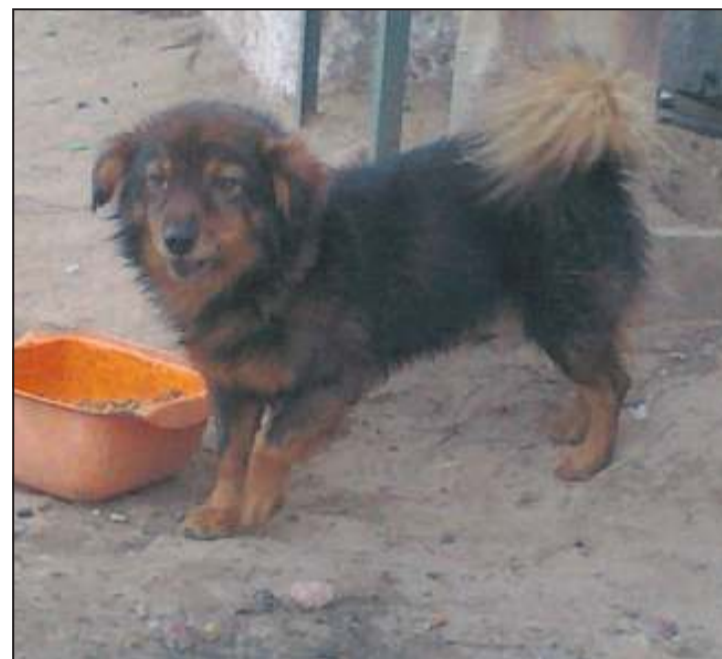
Pies czeka na właściciela lub nowy dom

Zainteresowanych adopcją zwierzaka prosimy o kontakt z Fundacją na Rzecz Praw Zwierząt „Nero” pod numerem telefonu: 502-156-186, lub mailowo: fundacjanero@gmail.com. Szukając przyjaciela warto zajrzeć na stronę: www.nero.egonet.pl oraz profil fundacji na facebooku. (ap)