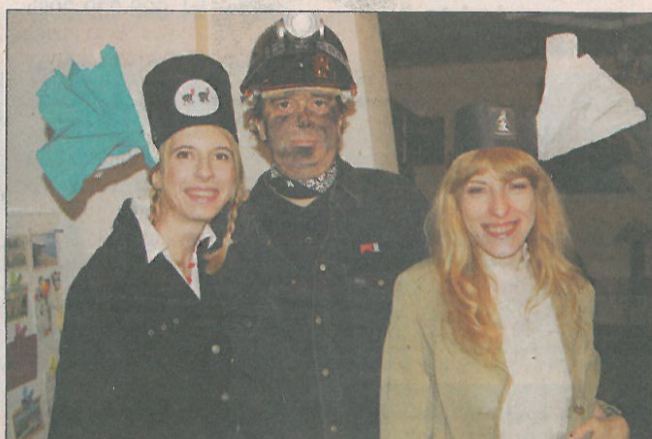
Na Mazowszu też obchodzi się barbórkowe święto