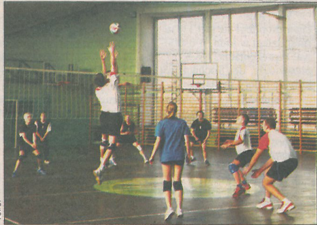
Fragment meczu poprzedniej kolejki Volley Sochaczew - Paprotnia