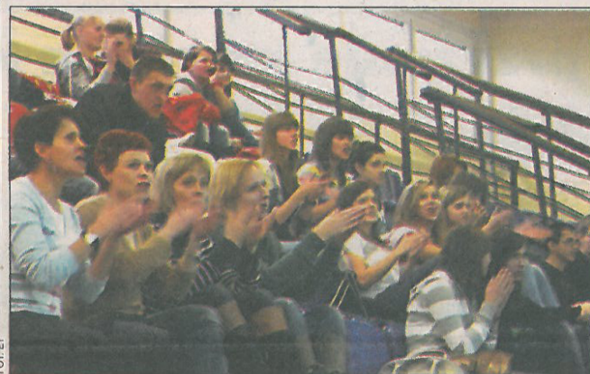
Kibice z Ogrodnika żywiołowo dopingowali swoją drużynę