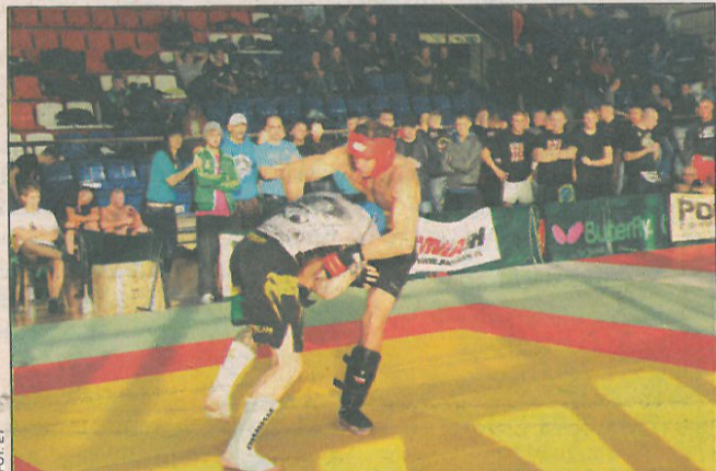
Na takie efektowne akcje czekają kibice MMA