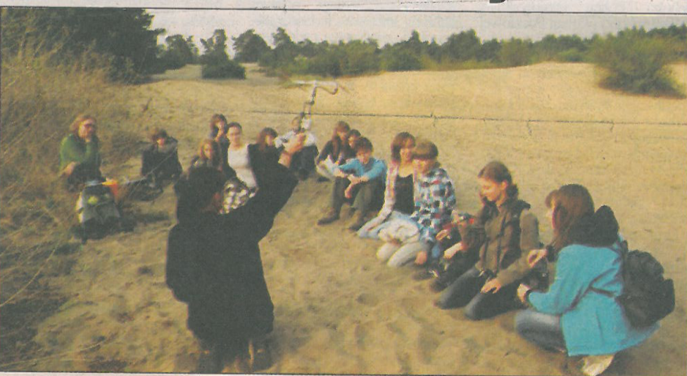
Zajęcia w terenie z echolokacji zwierząt

Wyjazd odbył się we wrześniu br. Wzięły w nim udział koła: biologiczne, fizyczne, chemiczne, geograficzne, informatyczne i interdyscyplinarne. W ciągu tych pięciu dni uczestniczyliśmy w warsztatach, ba-