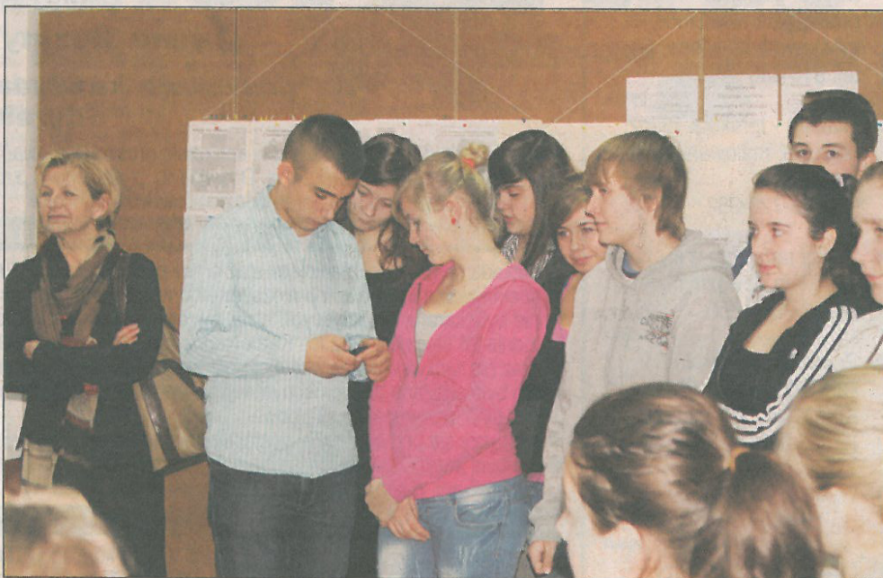
Młodzież z „dwójki” odwiedziła redakcję „ZS”

W minioną środę redakcję naszej gazety odwiedzili uczniowie Gimnazjum nr 2 im. Króla Władysława Jagiełły w Sochaczewie.