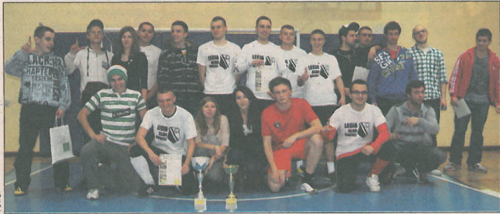
Rodzinne zdjęcie organizatorów, kibiców i drużyny Legii

Turniej piłki halowej zorganizowany przez Stowarzyszenie Promocji i Rozwoju Miasta Sochaczew wspólnie z Miejskim Ośrodkiem Sportu i Rekreacji ściągnął do obiektu przy ulicy Kusocińskiego aż 27 drużyn, nie tylko z naszego miasta, ale również z Warszawy i okolic