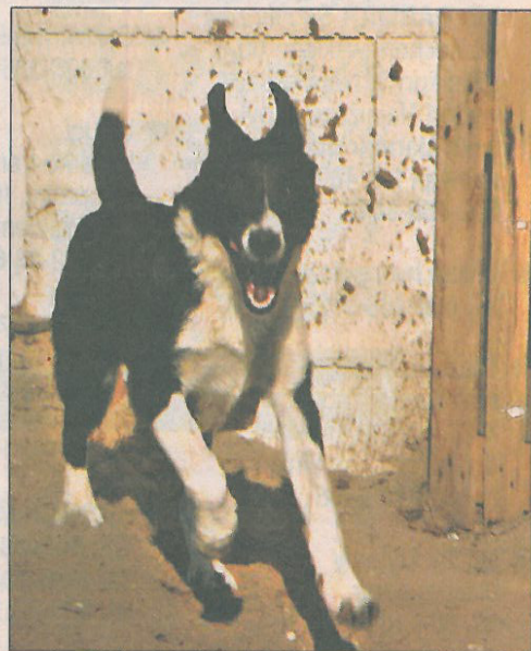
Bary jest wesołym i pojętym psem

Wszyscy, którzy są zainteresowani adopcją Bary’ego proszeni są o telefon pod numer 502-156-186. Inne zwierzęki znajdujące się pod opieką fundacji „Nero” można obej-