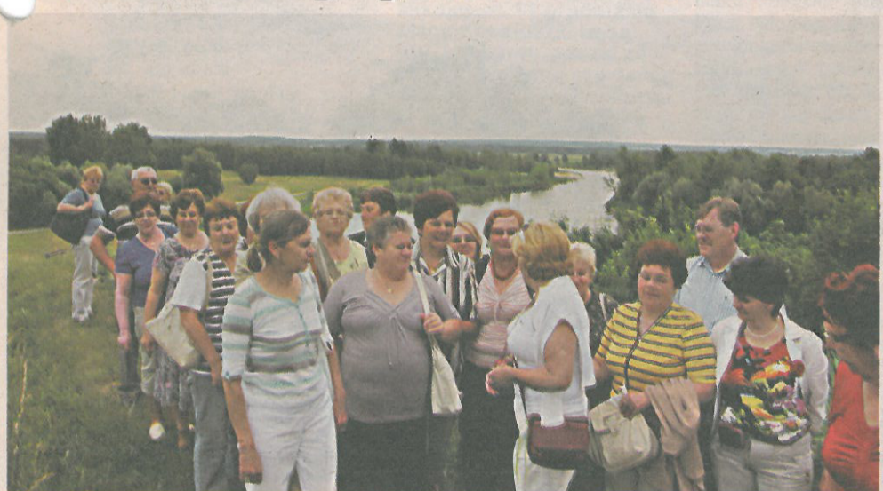
Seniorzy z Nowej Suche na wycieczce w Drohiczyźnie

Okazało się, że pomysł stworzenia w gminie Nowa Sucha grupy seniorskiej był strzałem w dziesiątkę. W bardzo krótkim czasie rozrosła się ona do blisko stu osób.