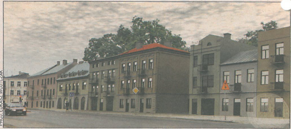
Być może tak będzie wyglądała kiedyś południowa pierzeja placu Kościuszki