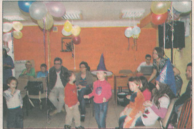
Balony, serpentyny i dobra zabawa

stają się partnerami w zabawie, przełamują dystans, jaki często stwarza służbowe biuro. To także okazja, aby pokazać mniej zaradnym rodzicom, jak niewiele potrzeba, aby dzieci poczuły się szczęśliwe. (sos)