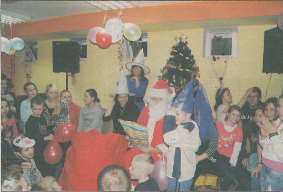
Święty Mikołaj zawiązał do MOPS

Czarodziejki, wróżki, Święty Mikołaj i dużo dobrej zabawy towarzyszyło andrzejkowo-mikołajkowej imprezie, jaka 30 listopada odbyła się w Miejskim Ośrodku Pomocy Społecznej. Uczestnikami spotkania byli mali podopieczni MOPS.