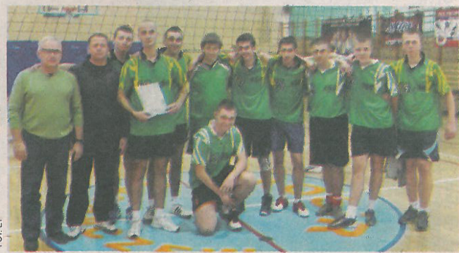
Zwycięska drużyna siatkarzy z ZSRCKU