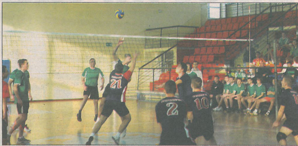
Przy siatce walczą drużyny ZS Teresin i ZS Iwazkiewicz

W minionym tygodniu odbyły się dwa turnieje Mistrzostw Powiatu Szkół Ponadgimnazjalnych chłopców. Tym razem na parkiet wyszli koszykarze i siatkarze. Dwukrotnie górą byli młodzi sportowcy reprezentujący ZSRCKU.