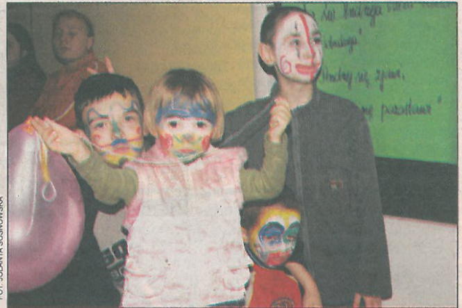
Mimo że rodzeństwo, a nie do poznania