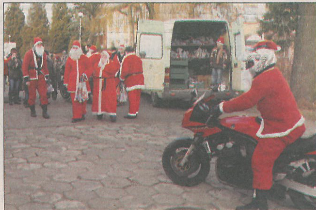
Motocykliści przywieźli dzieciom furgon ze słodyczami

Początek koncertów o godz. 17. Organizatorzy serdecznie zapraszają. (sos)