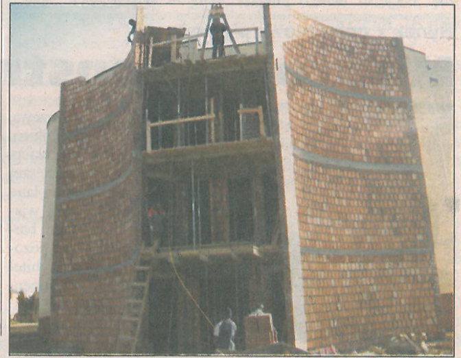
W szybkim tempie powstają mury plebanii w Boryszewie

Sylwetkę przyszłej plebanii widać już z ulicy 15 Sierpnia. Oprócz postawienia murów utwardzono gruntem teren za kościołem. Będzie służył jako parking parafianom załatwiającym sprawę w kancelarii. (jw)