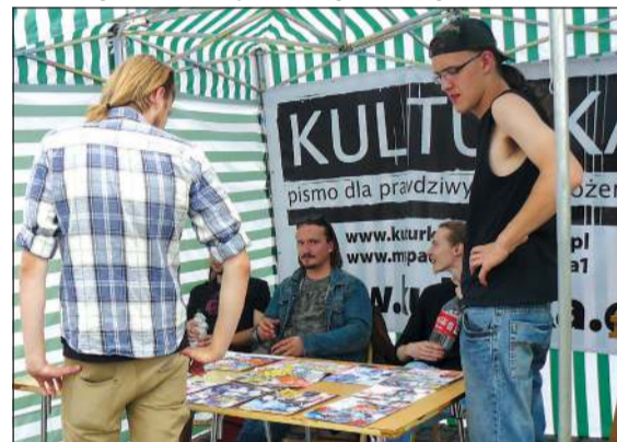
Z mieszkańcami rozmawiali redaktorzy „Kulturki”

Oprócz tego członkowie Falun Dafa zorganizowali warsztaty origami i kaligrafii. Zwłaszcza do tych pierwszych ustawiła się długa kolejka.