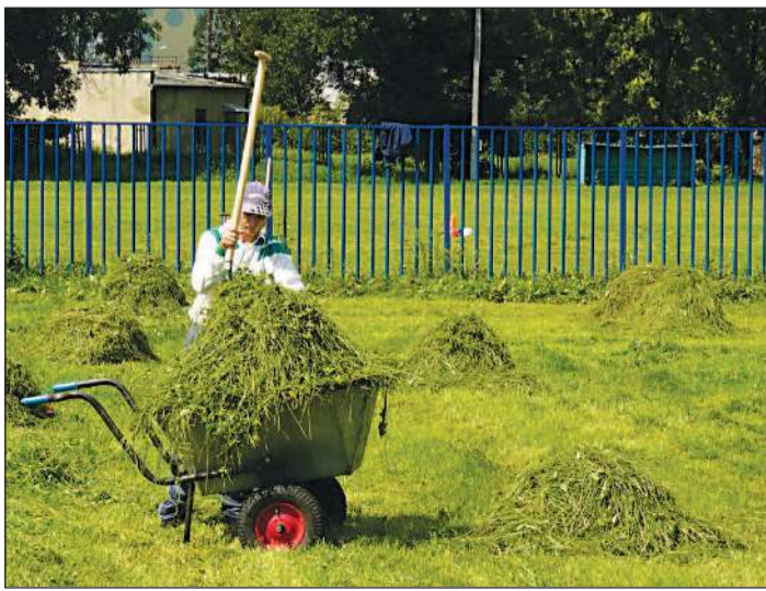
Sianokosy na Orkanie. Jak widać nasi w tym sezonie trawy nie gryźli