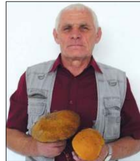
rodzinnych wypadów do lasu, choćby dla zdrowia. (b)