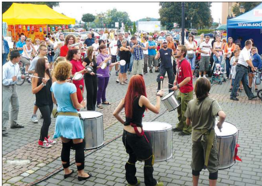
Gorące, brazylijskie rytmy zapewnił zespół L'ombelico del Mondo