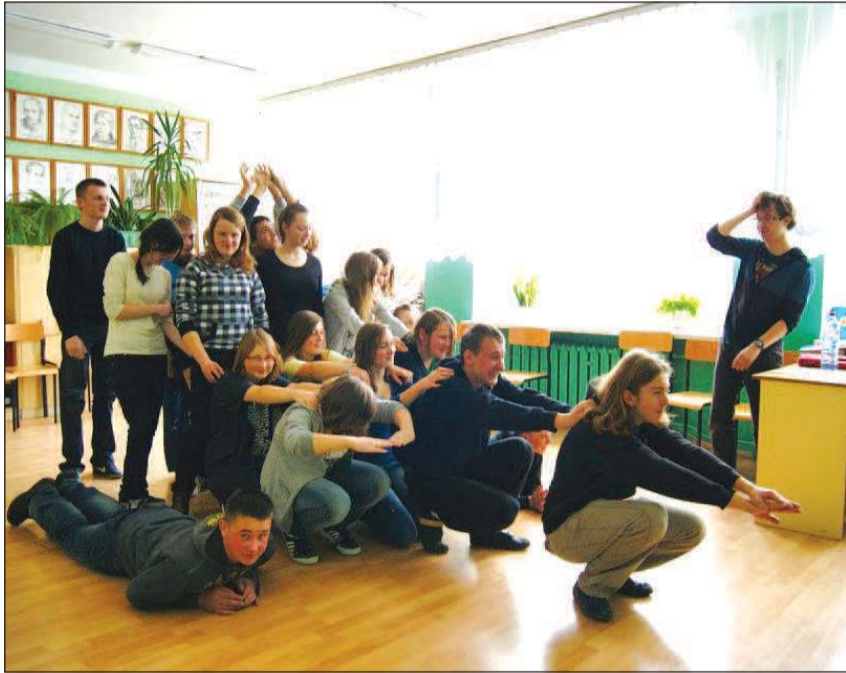
Układaliśmy ze swego ciała różne przedmioty i znaki