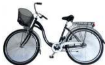
Sezon grzybiarski wchodzi w swój najlepszy czas. W