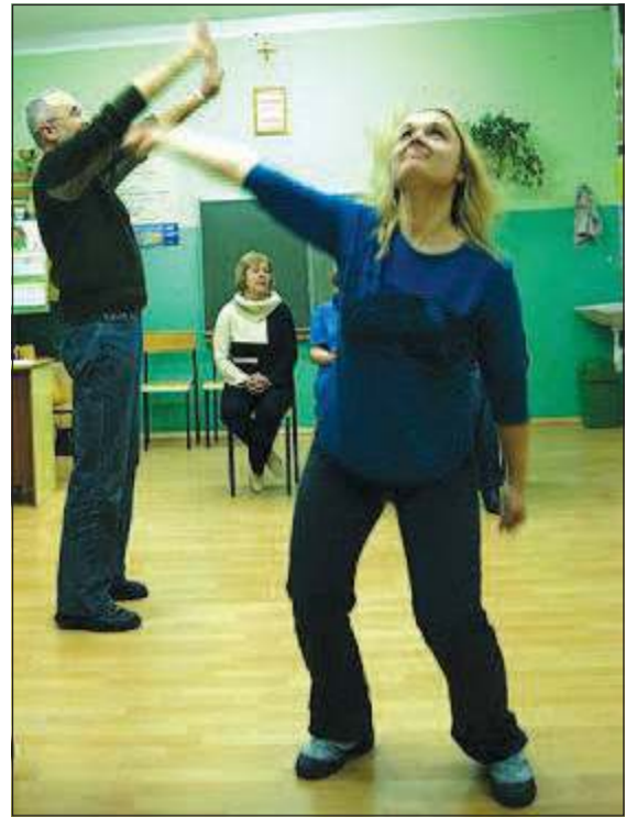
Pedagodzy teatralni zarzabili nas swoją pasją