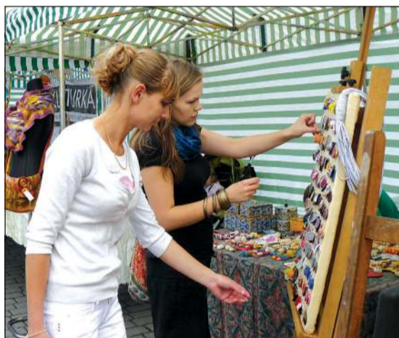
Rękodzieło było w cenie. Każdy chciał mieć coś niepowtarzalnego

Niedzielną impreza, jak zwykle, zgromadziła rzesze sochaczewian. Frekwencja cieszy tym bardziej, że długie weekendy z reguły zachęcają do wyjazdów poza miasto. Warto było wybrać się na pl. Kościu-