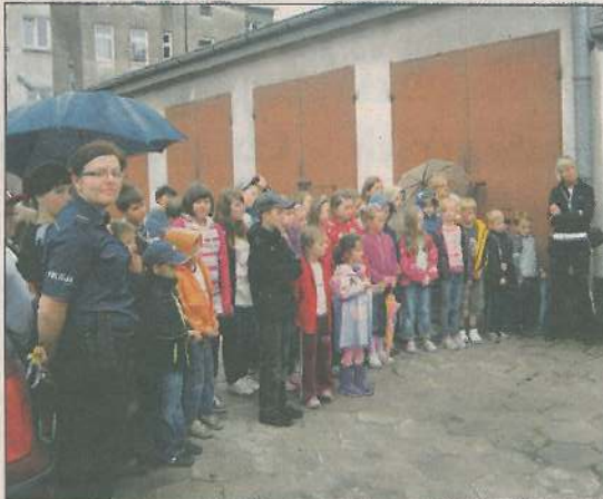
Podopieczni MOK z wizytą u policjantów

Przez cały szkolny rok funkcjonariusze z drogówki i z sekcji ds. nieletnich spoty-