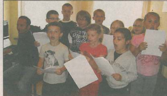
Dzieci nauczyły się nowych piosenek

Organizatorzy „Lata w mieście” serdecznie dziękują wszystkim za wspólnie i miło spędzony czas. Szczególne podziękowania kierują do władz miasta za dofinansowanie akcji. Miejskiemu Ośrodkowi Sportu i Rekreacji i Pływalni Orka dzieci dziękują za atrakcje, firmie Mars Polska za słodkości.