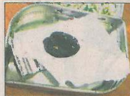
Przy zatrzymanym policjanci znaleźli pudełko z narkotykiem

alkoholu w wydychanym powietrzu. Okazało się też, że ma przy sobie pewną ilość haszyszu. Trafił do aresztu pod zarzutem kierowania pojazdem w stanie nietrzeźwym i posiadania narkotyków. Jego sprawę skierowano do sądu. (jw)