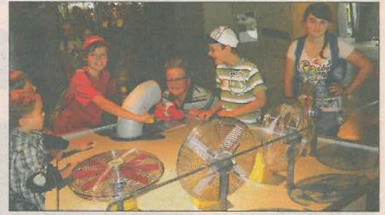
Czas w Centrum Nauki Kopernik mijał szybko

Pracownicy placówki i dzieci wdzięczne są władzom