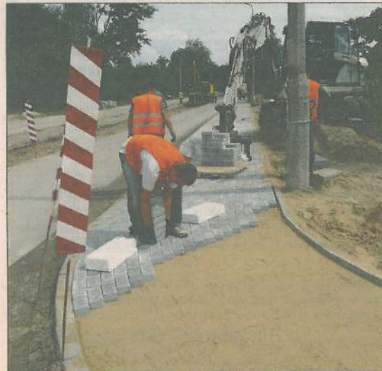
Przy ulicy Batalionów Chłopskich układany jest chodnik

Ludzi odwiedzających sochaczewski szpital rytują uciążliwości z dojazdem. Przewodząca do lecznicy ulica Batalionów Chłopskich od lat była bardzo zaniedbana. Dzięki porozumieniu trzech samorządów wpisala się we wspólny projekt stworzenia szerokiej, wygodnej trasy od ul. Gawłowskiej aż do Młodzieżyna.