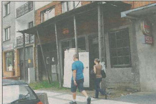
Kamienica przy ul. Warszawskiej od lat straszy

Kiedyś wydawało się, że będzie to jedna z ładniejszych kamienic w mieście. Na dodatek znajdowała się przy głównej ulicy. Były czasy, gdy niemal była wykonana. Niestety, właściciel nigdy się chyba nie wprowadził i dom przez lata, a minęło ich już ze dwadzieścia, niszczał. Co dziś z niego pozostało wszyscy widzimy, a tymczasem powstaje właśnie nowa ulica Warszawska. Po jej oddaniu do użytku, ruina, przez kontrast,