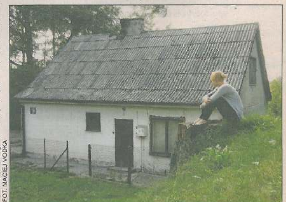
Miasto sprzedaje tylko część nieruchomości nad rzeką