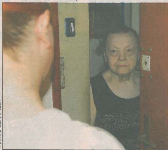
Starsze osoby, powinny uważać, kogo wpuszczają do domu

Starszej pani zginęła znaczna kwota pieniędzy trzy-