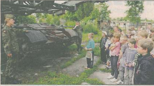
Spotkanie z wojskiem zawsze budzi emocje