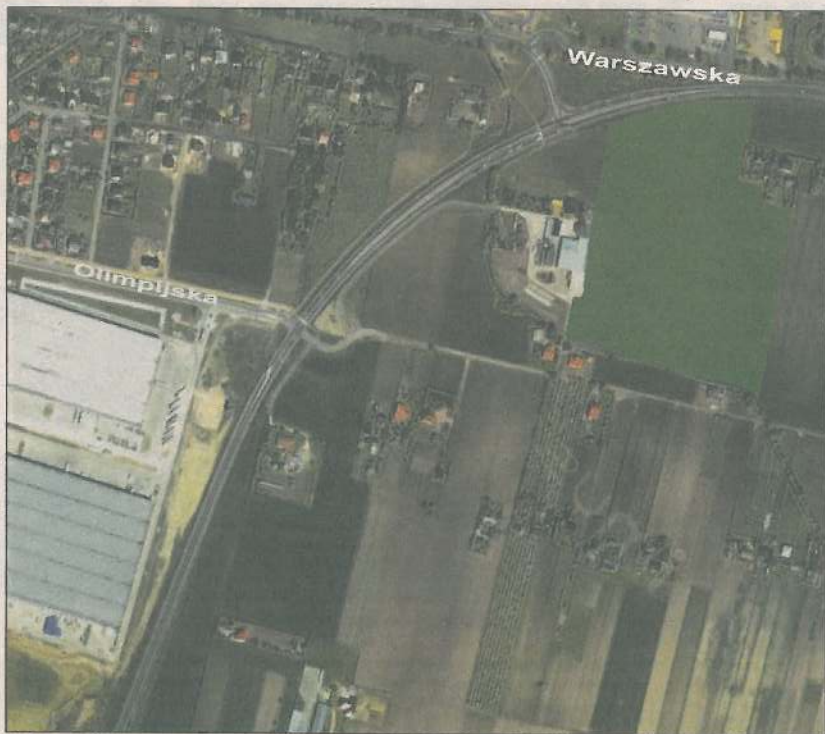
Kolorem zielonym zaznaczony teren planowanej inwestycji

Tym bardziej, że w okolicy jest już wspomniany Carrefour, a także siedziba urzędu gminy. Sporą połacią gruntu, rozpościerającą się pomiędzy marketem a urzędem interesuje się kolejny inwestor. Chee zbudować kolejny kompleks