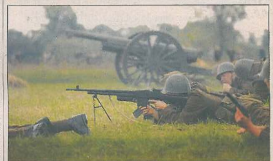
Członkowie grupy rekonstrukcyjnej nad Bzurą

Do Sochaczewa przyjechał ze swoją ekipą, która odpowiada za realizację cyklu. Przywiózł też ramowy program imprezy, która zapowiada się wyjątkowo atrakcyjnie. Jak wspominaliśmy, to nie będzie bowiem „tylko” inscenizacja. To będzie cały weekend z historią. W sumie prawie na trzy dni Sochaczew i okolice zmienią się najpierw w plan filmowy, później w muzeum polowe, wreszcie w miejsce imponującej inscenizacji. A to jeszcze nie koniec. Bo pomysł na Teatr Historii jest taki, że poza elementami widowiska historycznego, na uczestników będzie czekał także program artystyczny, za który odpowiada inna wielka telewizyjna gwiazda, znany z Teleexpressu Hirek Wrona.