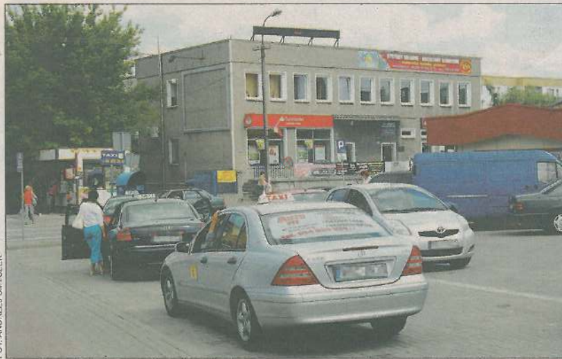
Obecny postój TAXI zamieni się w ogólnodostępny parking

Podobnie jak omawiany na spotkaniu plan zaostreżenia kontroli i restrykcyjnego zakazu handlu na chodniku przy ul. Pokoju wzdłuż targowiska. Rozwiązanie takie sprzyjałoby nie tylko utrzymaniu ogólnego porządku i bardziej sprawiedliwych zasad prowadzenia handlu wobec osób wynajmujących na nim przestrzenie