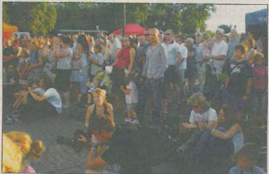
Występy oglądano w różnych pozycjach: siedząc, stojąc, zabrakło tylko miejsc do leżenia