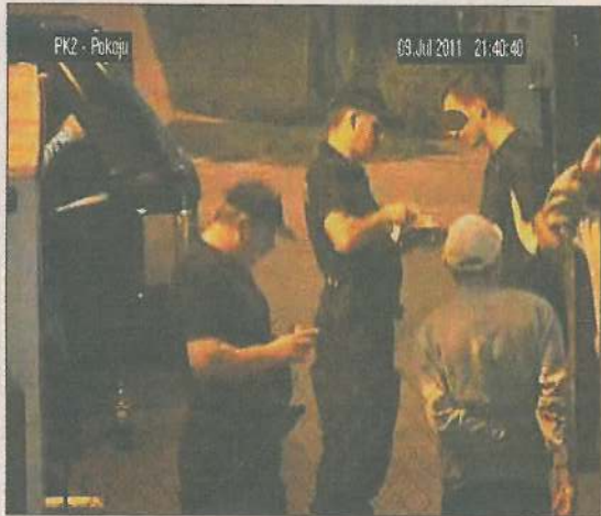
... i reakcja