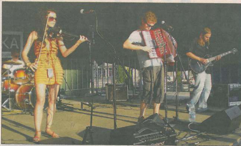
Gwiazdą wieczoru był sochaczewski zespół Del Arte