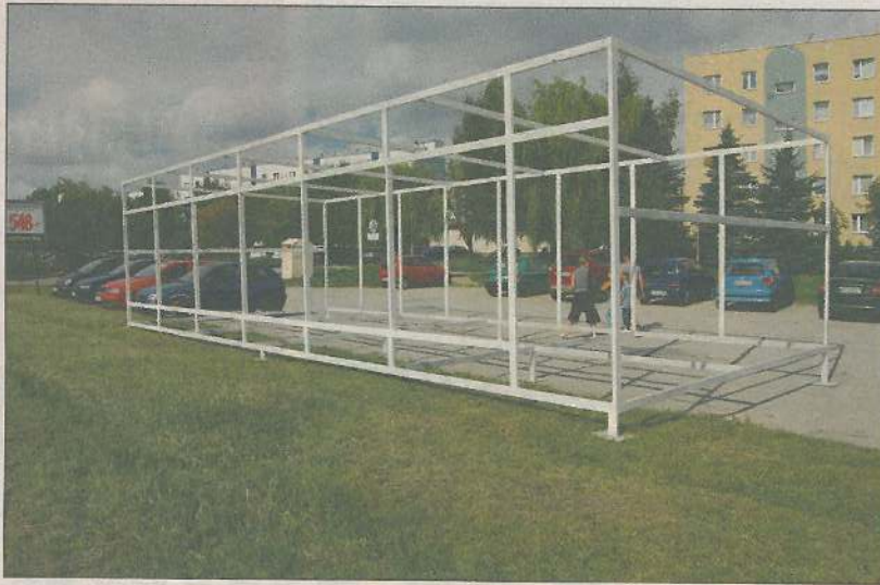
Budowlana prowizorka na spółdzielczym parkingu

Jak bardzo potrzebny jest parking przy ul. 600-lecia, widać zwłaszcza w dni targowe. Samochód stoi przy samochodzie, a i w uliczkach wiodących do osiedla ciasno. Tymczasem dzierżawiąca od miasta teren parkingu spółdzielnia mieszkaniowa pozwoliła tam postawić stalową konstrukcję pawilonu.