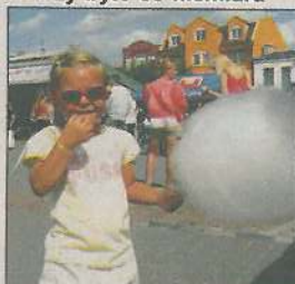
Na pikniku było wesoło i słodko

Poeta Konstanty Ildefons Gałczyński pisał niegdyś, że „Sztuka jest wieczną wiosną”. W ubiegłą niedzielę dowiedliśmy, że sztuka jest latem, w dodatku sochaczewskim, czyli twórczym, radosnym i rodzinnym.