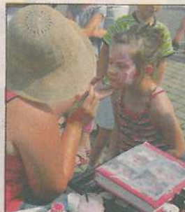
Chętnych do malowania twarzy było co niemiara

Gwiazdą wieczoru był sochaczewski zespół Del Arte. Pięciosobowa grupa młodych ludzi zagrała ponadgodzinny koncert, w czasie którego mogliśmy usłyszeć zarówno znane piosenki, jak i autorskie utwory zespołu.