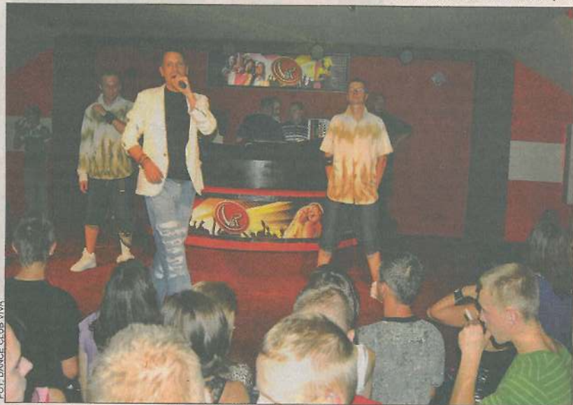
Podczas jednej z dyskotek młodzież zabawiła grupa Scanner

- W mojej dyskoteczce co sobota przebywało mnóstwo osób, 80 proc. stanowi młodzież. Fakt, dla nas liczy się, ile zarobimy, dlatego nie ma ograniczeń wiekowych. Jako szef widzę jedynie źródło dochodu, jako rodzic - strach, lęk, jestem przerażony tym, co wyprawia młodzież. Za moich czasów było inaczej, też chodziliśmy na dyskoteki, ale były one zupełnie inne. Dzieci pod