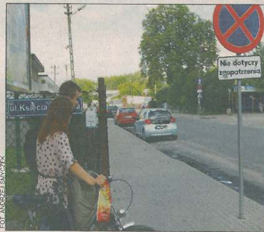
Znakiem zakazu postoju i zatrzymywania się nikt się nie przejmuje, gdy miejsc parkingowych zbyt mało

- Chcemy generalnie uporządkować teren przy dworcu, aby setki ludzi wyjeżdżających i przyjeżdżających do miasta nie czuły się tam zostawione same sobie - dodaje wiceburmistrz Wachowski. - Mamy świadomość obecnych niedostatków: wyboistych miejsc do parkowania przy dworcu i pod wiaduktem, nierównych chodników, zaniedbanej zieleni. Gdy tylko staniami się gospodarzem tego miejsca, poczynimy przy dworcu gruntowne porządki. Miejsca, gdzie dziś stoją kałuże zostaną utwardzone. Zadbamy też o przydworcową zielen. W tej chwili możemy tam postawić jedynie kilka gazonów. One