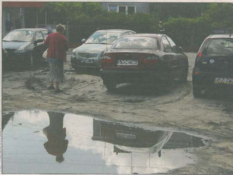
Na razie do auta można dojść przed dworcem pokonując kałuże

Burmistrz Sochaczewa Piotr Osiecki zamierza spotykać się z władzami PKP w odstępach tygodniowych. Na biurko jego zastępcy trafiają pierwsze kalkulacje ewentualnych kosztów budowy parkingu. Parking na 150 samochodów kosztowałby od 1,4 do 1,7 mln zł. Na początek miasto chce wybudować parking średniej