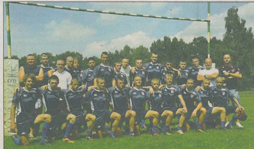
Czwarta drużyna XVII Ogólnopolskiej Olimpiady Młodzieży - Orkan Sochaczew