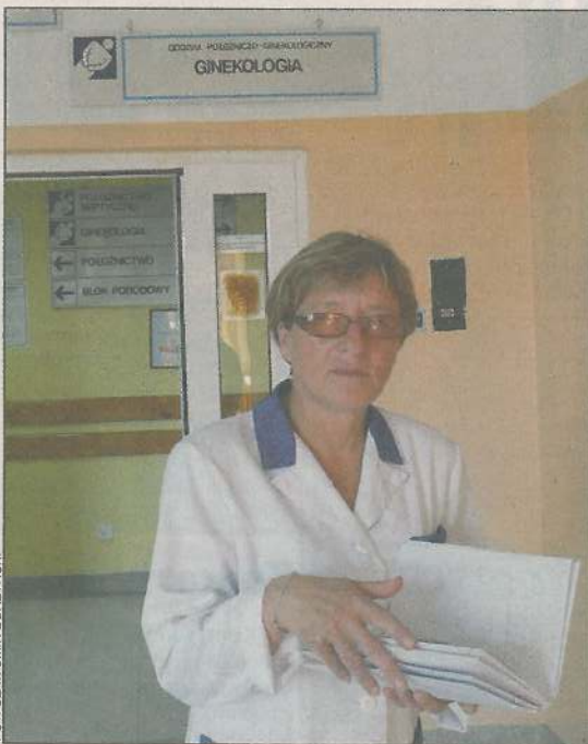
Na oddziale ginekologii trwa sytuacja niepewności

Ze słów pani ordynator wynika, że zabiegów na ginekologii jest stosunkowo niewiele. Zazwyczaj chodzi o przypadek pękniętej torbieli czy ciąży pozamacicznej. Inne przypadki patologii ciąży też się zdarzają, ale wówczas pobyt pacjentek w szpitalu są krótkie. Lekarze z ginekologii są przy każdym porodzie, bo taki jest wymóg. Na dodatek przyjmują w szpitalnej poradni „K”. I wszystko to jest potrzebne, tyle, że kubaturowo i powierzchniowo oddział jest