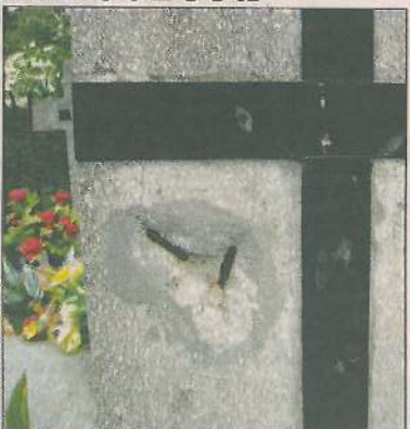
Na wielu grobach widoczne są ślady podważania łomem figurek. Zostały wyrwane razem z mocującymi je śrubami.

Prawdopodobnie i teraz cmentarni złodzieje oberwane figurki i płaskorzeźby z mosiądzu sprzedadzą. Właściciele i pracownicy punktów skupu złomu z pewnością domyślają się, że dostarczany im „złom” pochodzi z kradzieży. W takiej sytuacji powinni odmówić jego przyjęcia i powiadomić policję o podejrzeniu popełnienia przestępstwa. Jeśli tego nie czynią, mogą odpowiadać przed sądem na równi ze złodziejami. (jw)