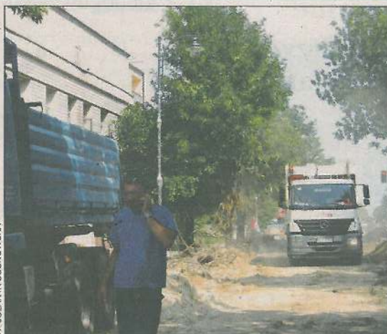
Remont odcinka ulicy Warszawskiej przebiega sprawnie