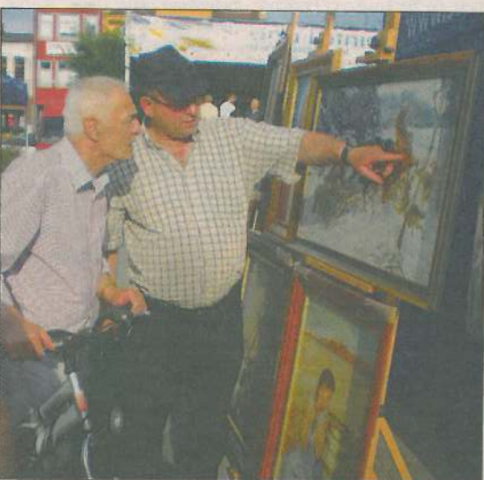
Wśród publiczności nie zabrakło koneserów sztuki