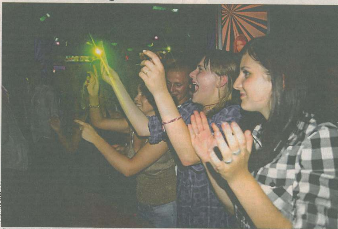
Przy estradzie można dać upust emocjom

nie o przesłanie, które ma otworzyć umysły młodzieży na brutalne realia. Jego bohaterowie to prości mieszkańcy wsi, którzy cały tydzień z utęsknieniem czekają na jedyną w ich życiu rozrywkę, sobotnią dyskotekę. Niektórzy z nich przyznają, że woliliby wyskoczyć do kina czy teatru, by mieć kontakt z kulturą wyższą, ale nie mają dostępu do takich miejsc.