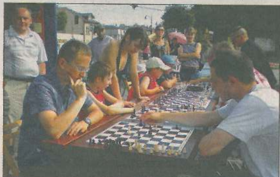
Tym panom piknik kojarzył się wyłącznie z gimnastyką umysłu