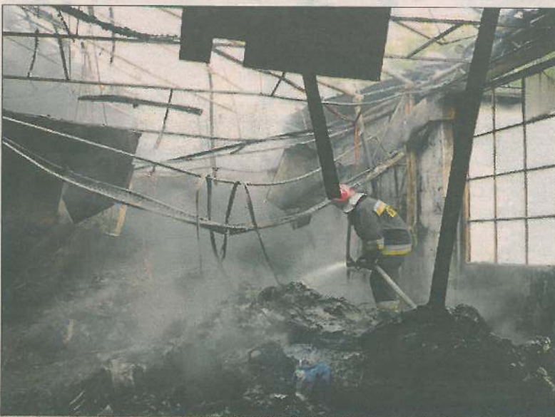
Jeszcze długo po zdarzeniu strażacy dogaszali ogień

W poniedziałek 11 lipca, tuż po godzinie 5 rano, straż została wezwana do pożaru hali przetwórstwa tworzyw sztucznych przy ulicy Długiej. Do akcji wyruszyły dwa zastępy gaśnicze. Strażacy zaczęli walkę z ogniem w miejscu, gdzie znajdowały się tworzywa sztuczne przygotowane do przetworzenia na granulaty. W wyniku pożaru spaleni uległa część hali z fragmentem dachu, a także maszyny.