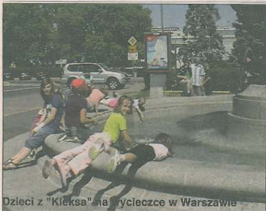
Dzieci z „Kleksa” na wycieczce w Warszawie

Definitywnie zakończyliśmy i rozliczyliśmy akcję „Paczka do paczki” w sezonie 2010/2011. Na Dzień Dziecka wydaliśmy ponad 4 tys. zł, dofinansowując świetlice i ogniska wychowawcze dla dzieci z rodzin niezamożnych i dysfunkcyjnych.