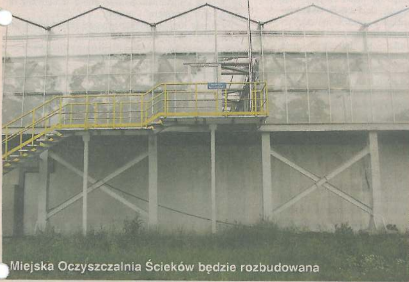
Miejska Oczyszczalnia Ścieków będzie rozbudowana

Pełnym sukcesem zakończyły się starania Zakładu Wodociągów i Kanalizacji dotyczące dofinansowania ogromnego projektu wodno-kanalizacyjnego dla Sochaczewa.