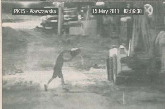
PK15 - Warszawska 15.May.2011 02:06:30