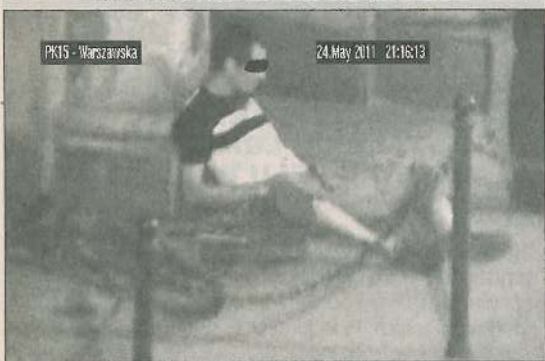
PK15 - Warszawska 24.May.2011 21:16:13