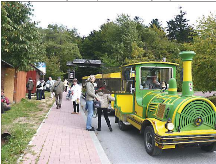
Kolejka na Święty Krzyż