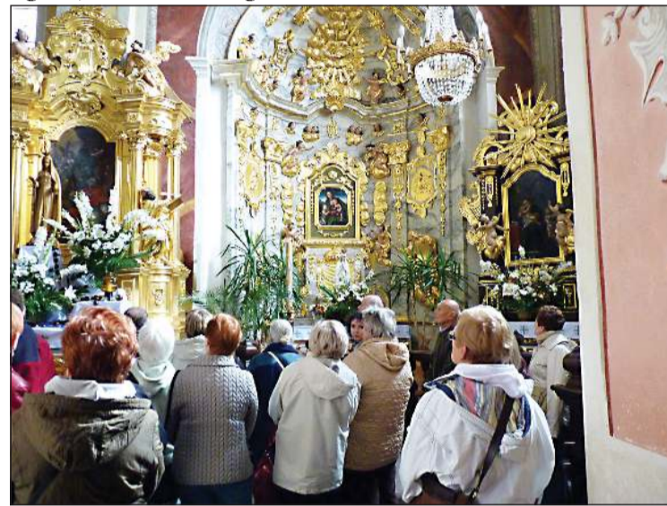
Kolegiata w Opatowie - ołtarz główny