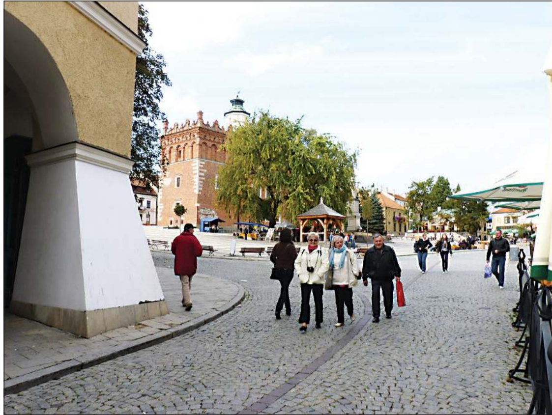
Rynek w Sandomierzu

Oddział Towarzystwa Polsko-Serbołużycyckiego w Sochaczewie pragnie na łamach "Ziemi Sochaczewskiej" podzielić się z mieszkańcami wrażeniami i przeżyciami z wycieczki po Ziemi Świętokrzyskiej. Tę trzydniową wyprawę Towarzystwo zorganizowało we własnym zakresie. Gdy wszystko zostało przygotowane, w grupie 50 osobowej, wsiedliśmy do autokaru i w drogę do Sandomierza!