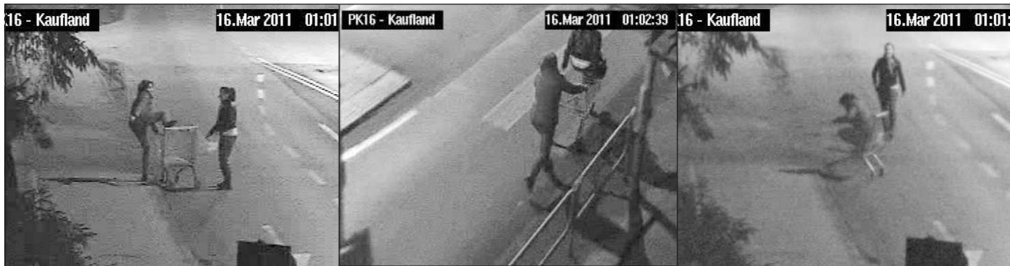
OKIEM KAMERY MONITORINGU

Cieszy nas, że, jak twierdzi szef miejskiego monitoringu, publikowane w "Ziemii" zdjęcia z jego kamer sprawiają, iż spada w tych miejscach liczba przestępstw i wykroczeń.