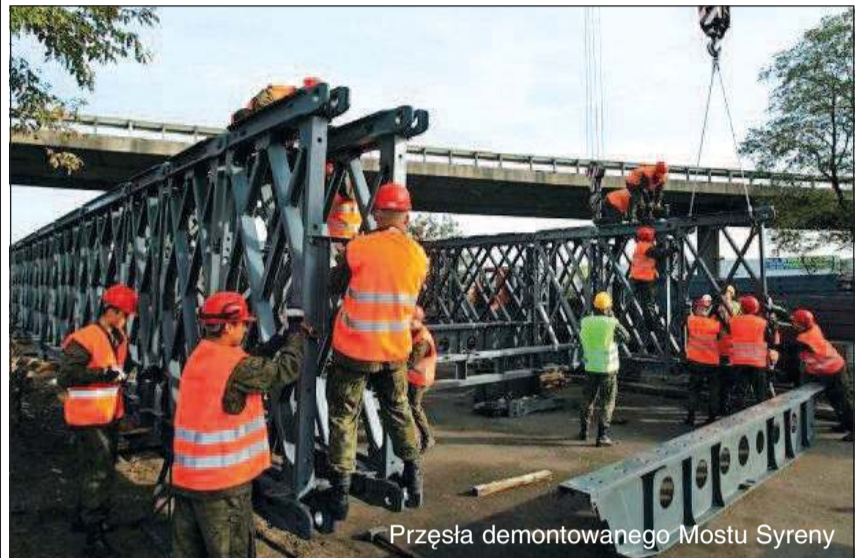
Prześla demontowanego Mostu Syreny

O d ponad dwóch miesięcy problem zamkniętego mostu w Kozłowie Szlacheckim spędza sen z powiek mieszkańcom gminy Nowa Sucha. Próba znalezienia wyjścia z trudnej sytuacji jest nielatawa, bo w grę wchodzi jak zwykle pieniądze. Padają jednak pomysły rozwiązania problemu.