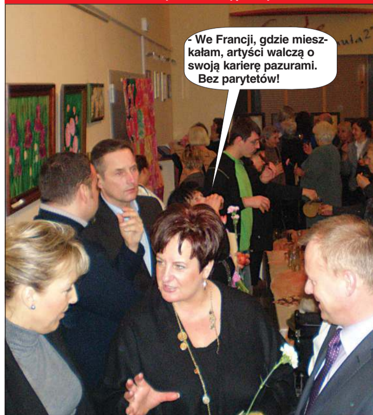
Pierwsza Dama Sochaczewa na wystawie "Malujące Ewy".

- We Francji, gdzie mieszkałam, artyści walczą o swoją karierę pazurami. Bez parytetów!