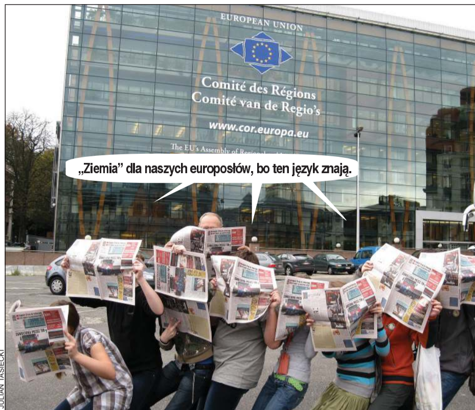
Happening „Ziemi Sochaczewskiej” przed budynkiem Parlamentu Europejskiego w Brukseli