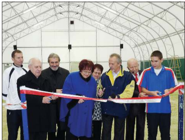
Materiał przygotowany i opłacony przez KWVW Porozumienie Ziemi Sochaczewskiej