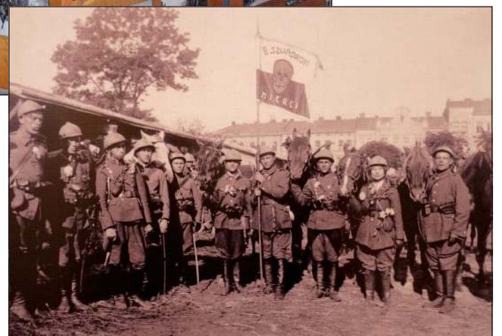
Lwów - 1920r. Oddział ochotniczy II Szwadronów Śmierci przed wyruszeniem na front.