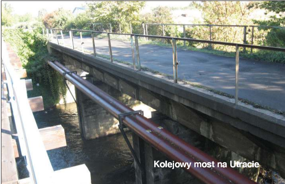
Kolejowy most na Utracie

Gdy latem tego roku doszło do zarwania części jezdni w użytkowanym moście drogowym przy al. 600-lecia, wszystkie lokalne media pokazywały mieszkańcom naszego powiatu tylko ten jeden most. Nikt nie zainteresował się tym, ile mostów i kładek oraz przepustów wodnych znajduje się w granicach naszego miasta. Przybliżymy więc mieszkańcom ten nieznany, a czasami zapomniany temat.