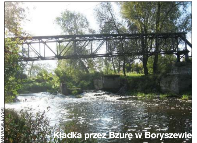
Kładka przez Bzurę w Boryszewie

Jest jeszcze przy ujściu Pisi do Bzury niezwykle malownicza metalowa kładka dla pieszych wykonana kilkadziesiąt lat temu przez boryszewski zakład. Ta służy do dziś nie tylko pracownikom Boryszewa i okolicznym mieszkańcom, ale również wędkarzom.