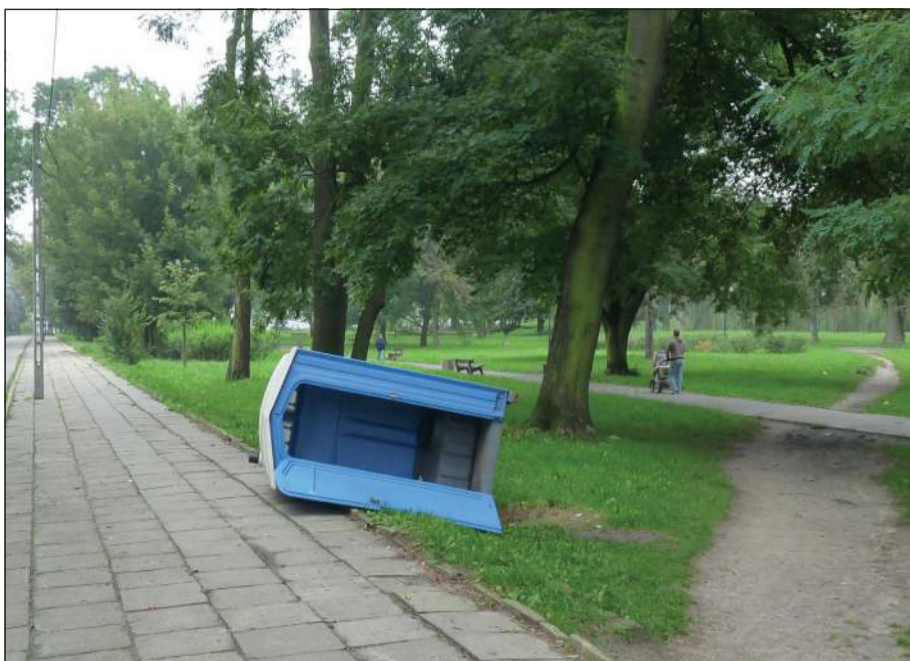
Długo oczekiwana przez odwiedzających Park Garbolewskich toytotka komuś jednak przeskadzała.