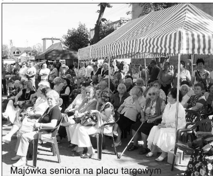
Majówka seniora na placu targowym

Doświadczenie 18 lat odrodzonego samorządu wskazuje, że jedną z najskuteczniejszych metod poprawy jakości usług dla mieszkańców jest wdrażanie innowacji, które zostały wcześniej opracowane i przetestowane w innych jednostkach, a następnie twórczo przystosowane do własnych