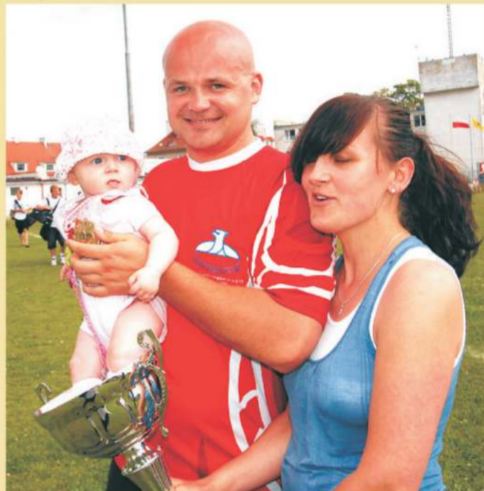
Pierwszy po trzydziestu latach Puchar Polski dla Orkana może powtórzy ten bobas.