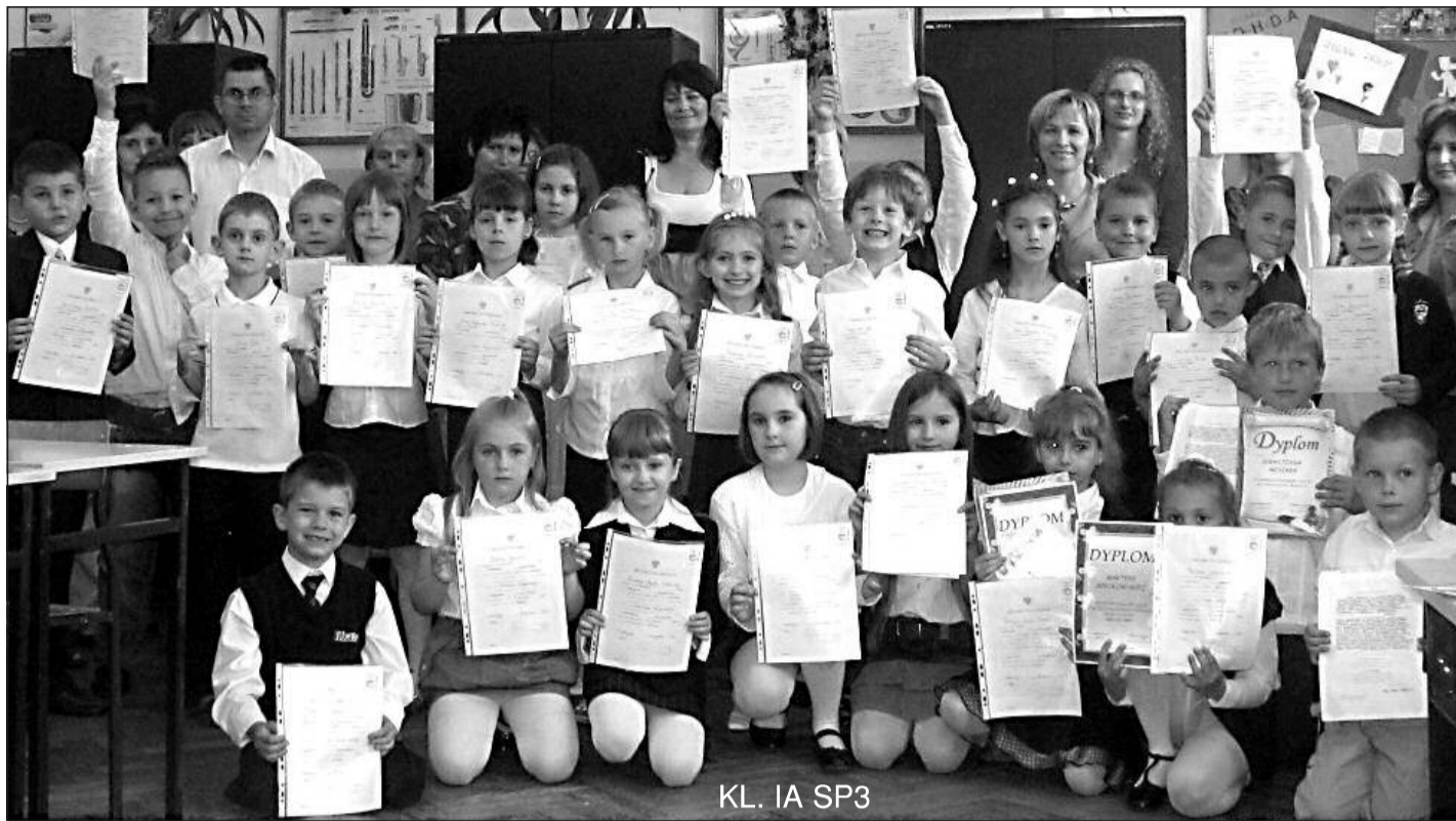
KL. IA SP3