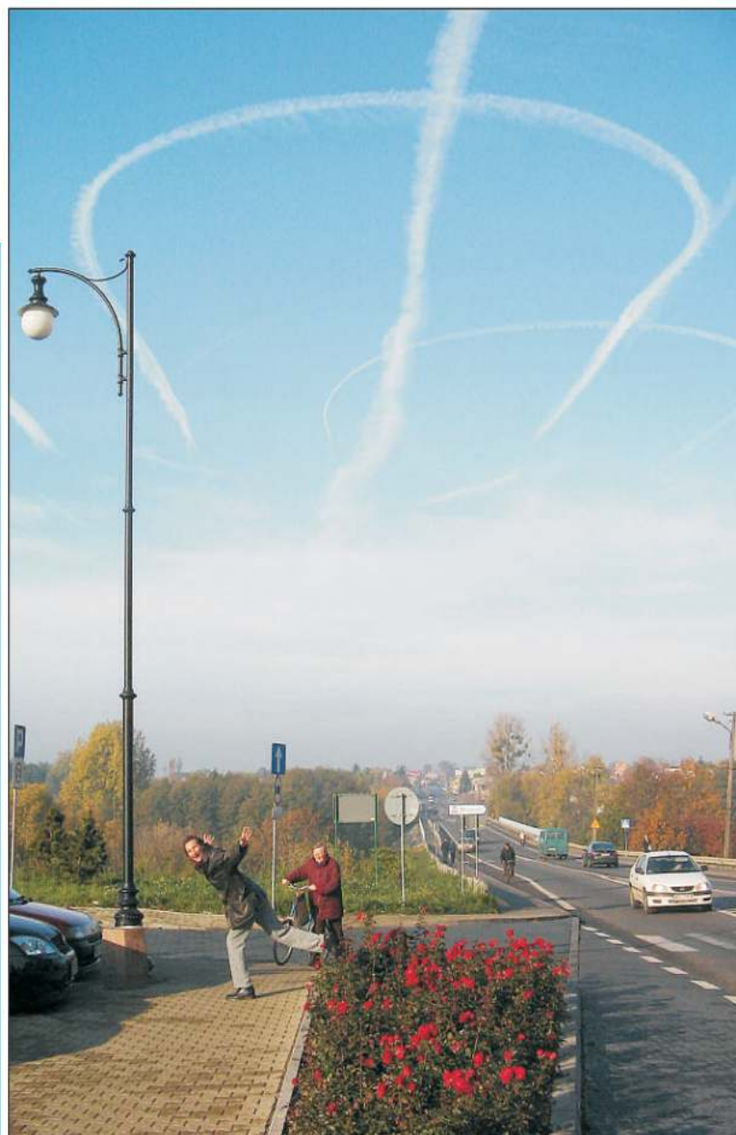
Kraży nad nami jakieś UFO, podobno przygląda się samorządowym wyborom. Zwycięzców ma porywać, by zwracać cyborgów. To się potem naszym władzom nie dziwny.

■ Pewien pan wrócił z zagranicznej podróży i zobaczył, że w jego mieszkaniu buszuje jakiś facet. Zaczaił się więc i gdy tamten wychodził z torbą, trzasnął go w nos. W torbie znalazł osobiste rzeczy tamtego i dowiedział się, że to przyjaciel jego żony. Podróże kształcą.