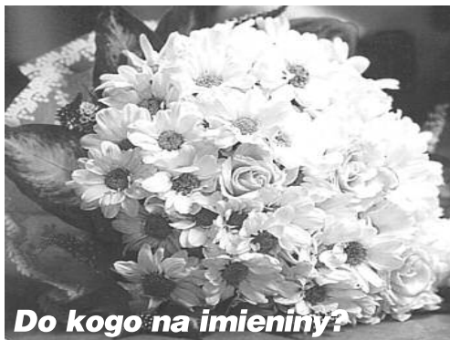
Do kogo na imieniny?