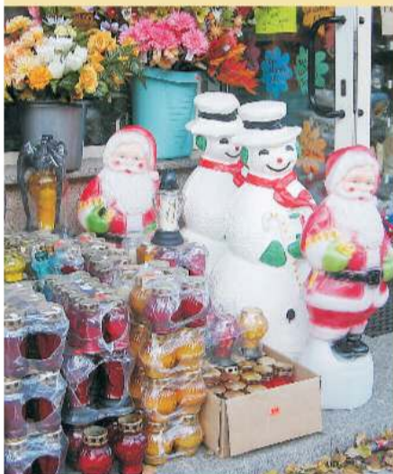
Przyszła moda na plastikowe krasnale również w „grobowych ogródkach”.