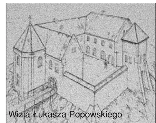
Wizja Łukasza Popowskiego

Architekt Marek Hryniewicki prezentował z kolei gościom projekt rewitalizacji wzgórza i terenów wokół. W pierwszej kolejności wskazywał na konieczność wykonania ścian oporowych i zabezpieczenia skarpy. Na samym wzgórzu proponował natomiast utworzenie prawie 4 tys. m 2 powierzchni użytkowej, na której, oprócz ekspozycji, mogłyby powstać sale konferencyjne i miejsca na działalność gospodarczą. A wszystko z zastosowaniem nowoczesnych rozwiązań budowlanych i technologicznych.