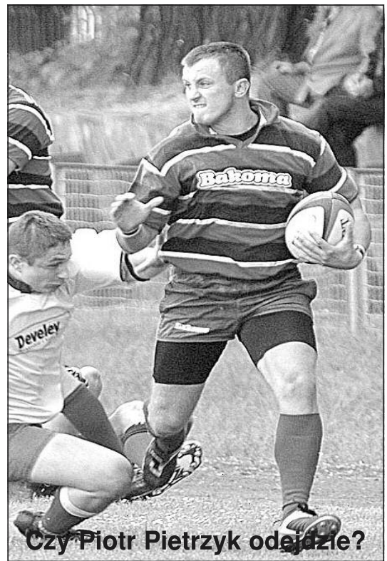
Czy Piotr Pietrzyk odejdzie?