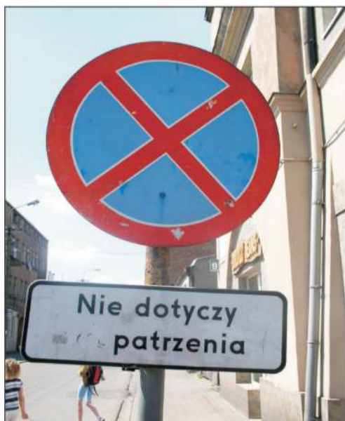
Na ul. Reymonta na sklep z alkoholem można tylko popatrzeć.