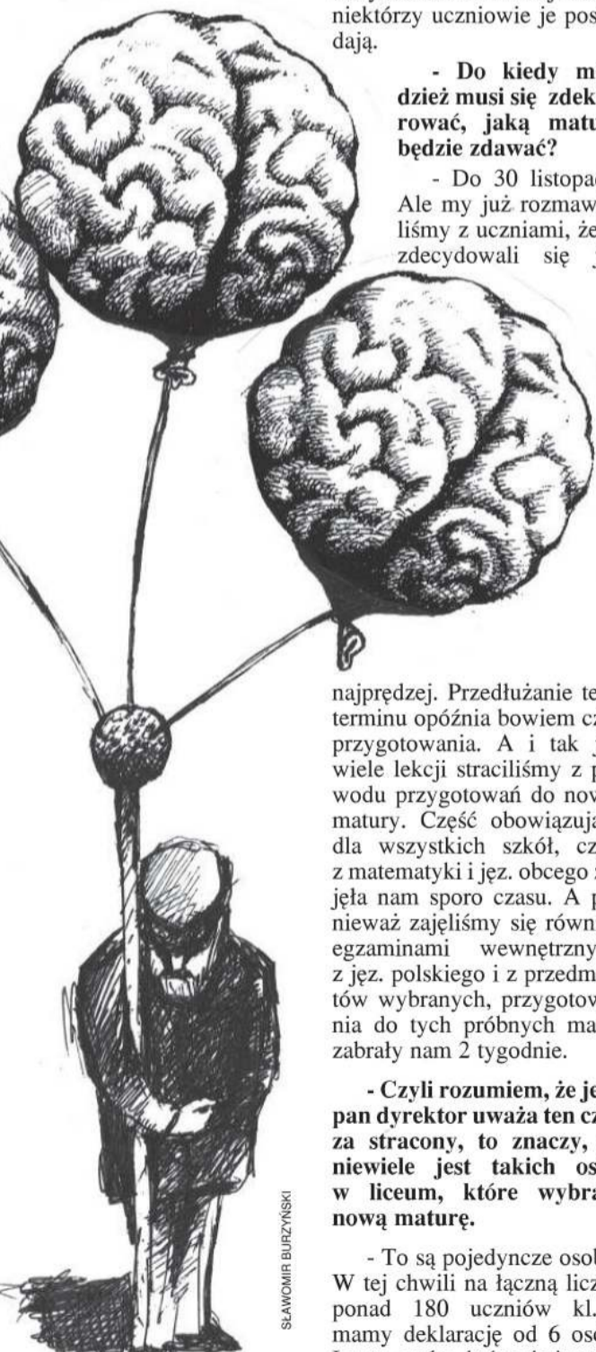
Dokończenie na str. 7

- W kwestii nazewnictwa to jest tak: jeżeli uczniowie wybiorą dotychczasowy egzamin, to nazywa się on tak jak do tej pory egzaminem dojrzałości. Jeżeli natomiast nowy, to jest już egzamin maturalny. Trzecia możliwość to egzamin dojrzałości z nowymi elementami, czyli tzw. matura pomostowa. Jeżeli uczeń zdecyduje się na egzamin dojrzałości, ma możliwość zdawania w części ustnej jęz. polskiego z przedstawieniem przygotowanego przez siebie tematu. Bo do nowej matury trzeba było wybrać na część wewnętrzną, czyli ustną, konkretny temat. Dostali je wszy-