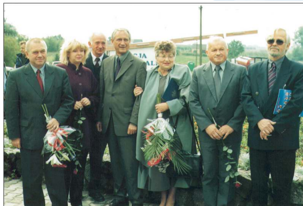
W piątek, 14 września, w Iłowie gościli liderzy SLD