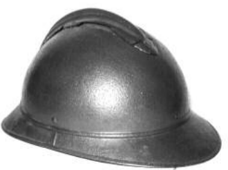
Hełm francuski z 1915r, używany przez żołnierzy polskich w 1939r.