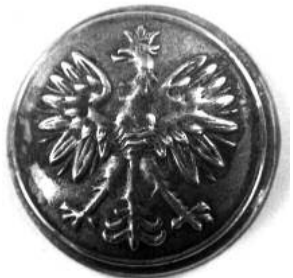
Guzik mały z 1928r od kurtki oficerskiej z 1936