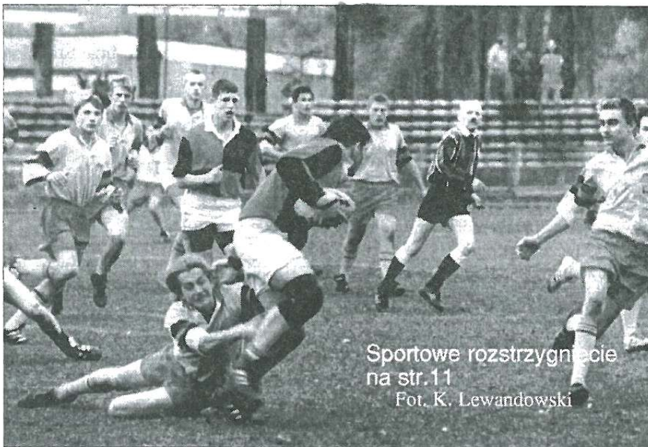
Sportowe rozstrzygnięcie na str. 11

wili, że są mile zaskoczeni przyjęciem w Sochaczewie, w ciągu tygodniowego pobytu nawiązali wiele prywatnych znajomości i będą starali się je kontynuować,