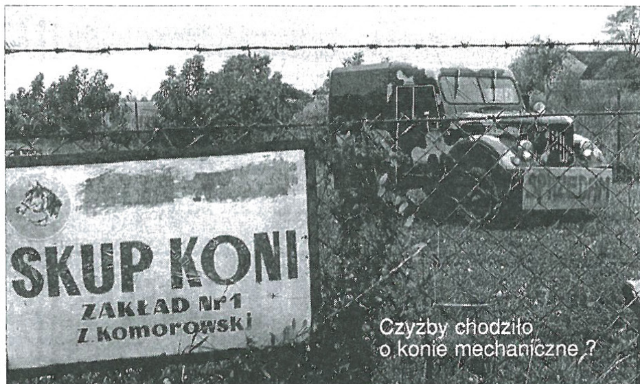
Czyżby chodziło o konie mechaniczne?

- Z włóczki nie takie rzeczy już robiłam!