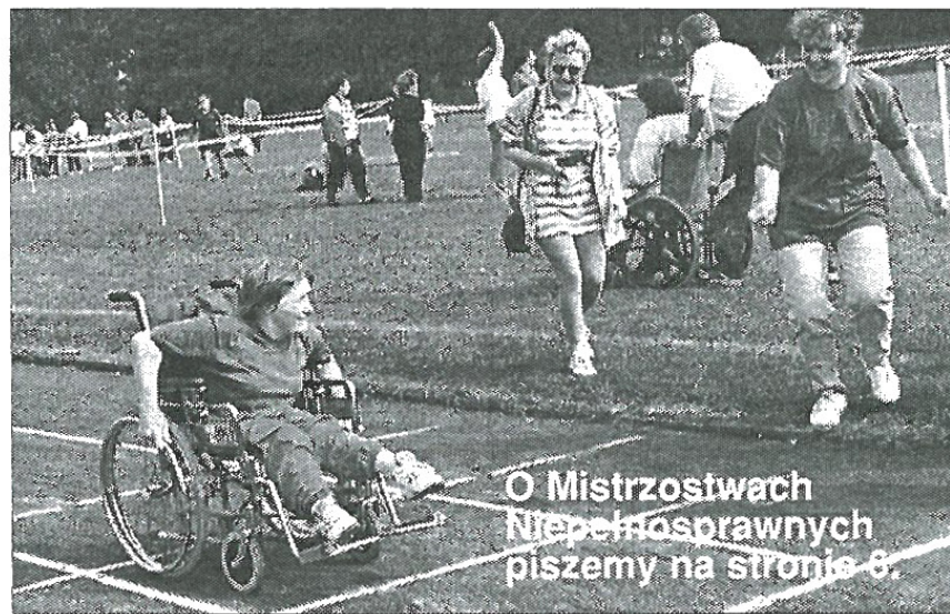
O Mistrzostwach Niepełnosprawnych piszemy na stronie 6.