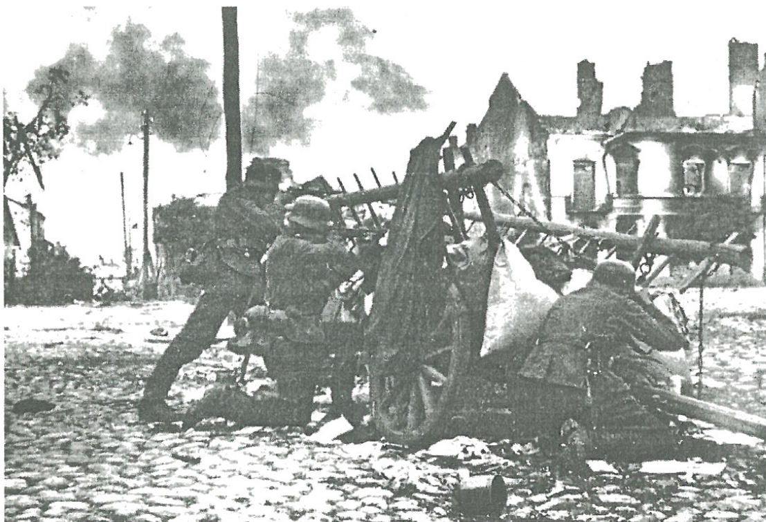
Walki w ruinach i zgliszczach rynku

Około północy z 13 na 14 września silne natarcie przeważających sił niemieckich zmusza wyczerpany i wykrwawiony batalion do wycofania się na zachodni brzeg Bzury.