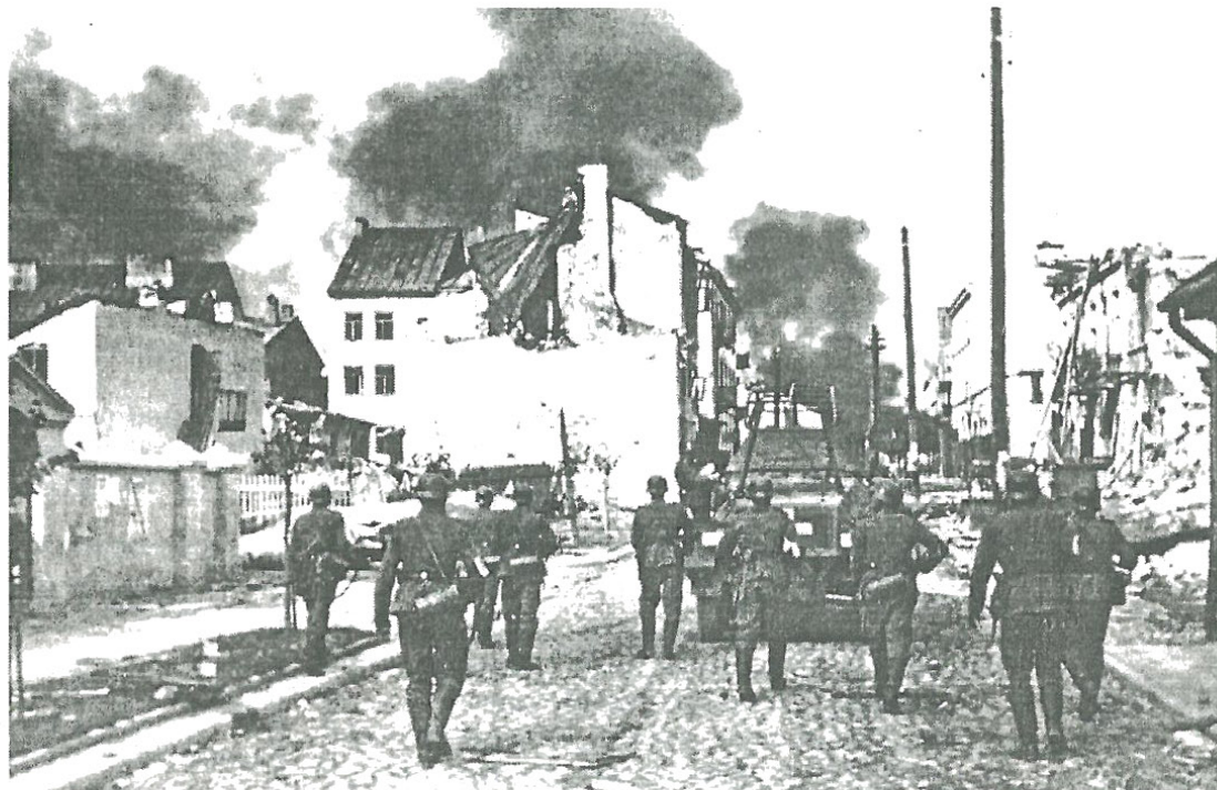
Oddziały niemieckie wkraczają do Sochaczewa

W walkach o Sochaczew II batalion został zdziesiątkowany. Liczby zabitych, rannych i zaginionych podoficerów i szeregowych tego batalionu oraz 5 baterii II/25 pułku artylerii lekkiej nie udało się ustalić. Według przybliżonego szacunku ogólne straty wyniosły około 80%.