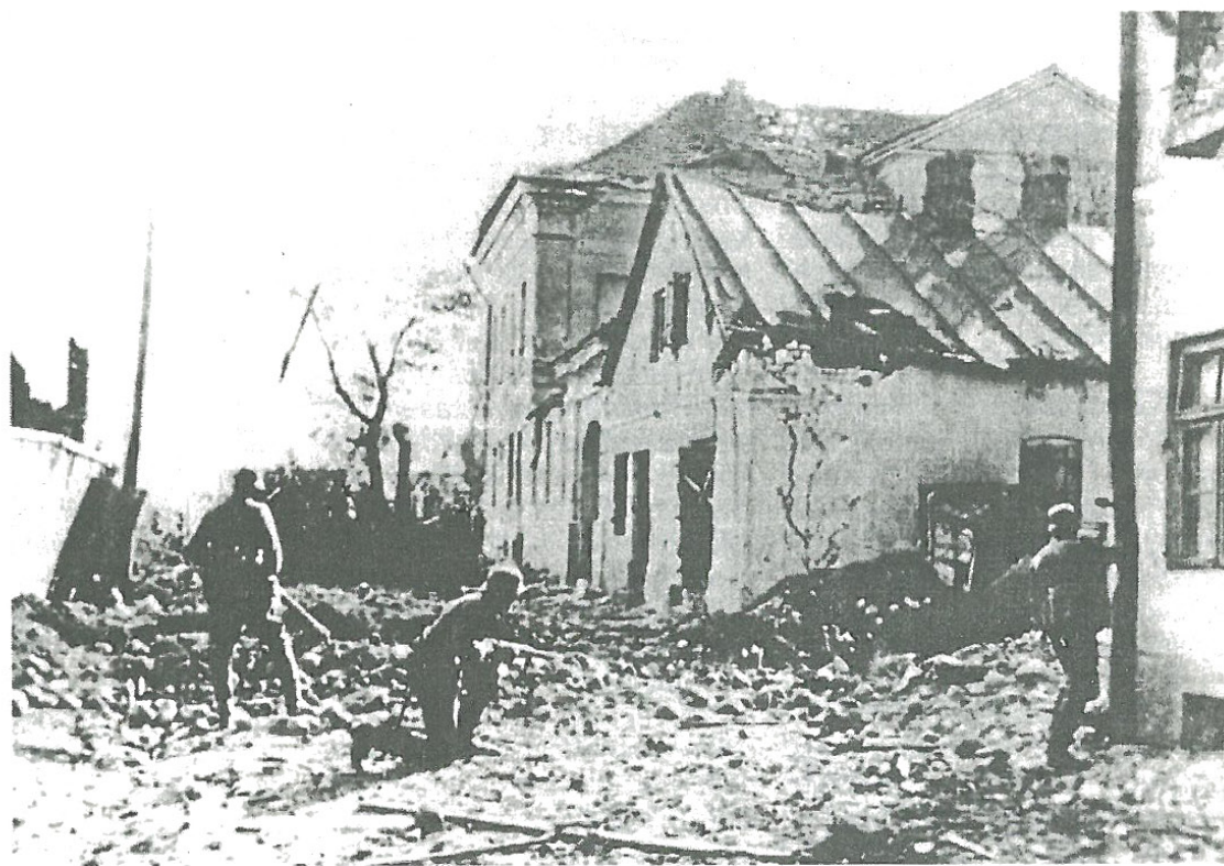
Niemcy w natarciu przy Ratuszu miejskim w Sochaczewie