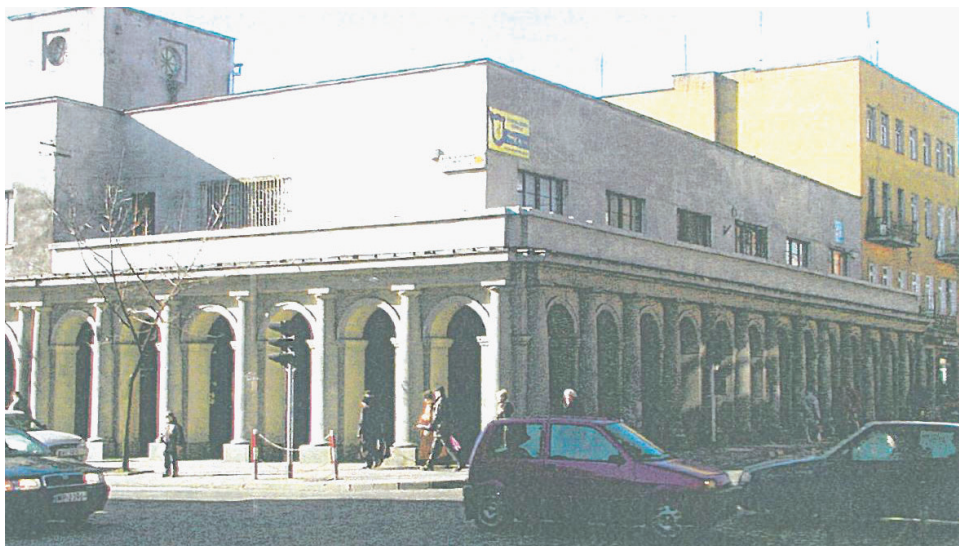
Kramnice przed kompleksową przebudową zakończoną w 2013 roku.