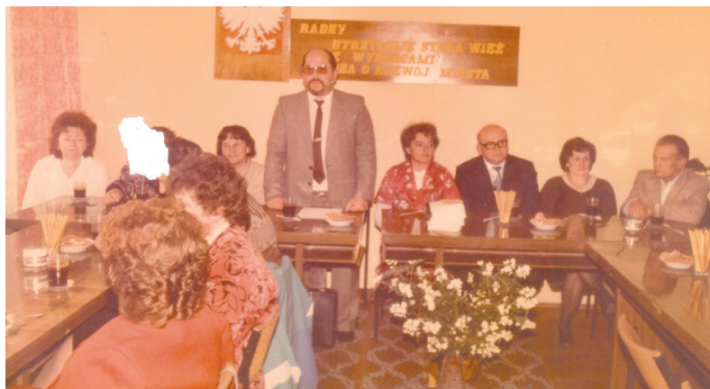
Uroczystość wręczenia zaświadczeń o uzyskaniu mandatów, 10.06.1990 r.