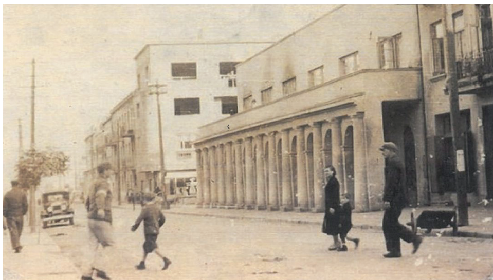
Ulica Warszawska, lata 30. XX wieku. Dom Kobka w budowie

2013 pełnił funkcję rektora Wyższej Szkoły Bankowej w Toruniu. Łącząc go także związki z Katedrą Prawa Międzynarodowego i Prawa