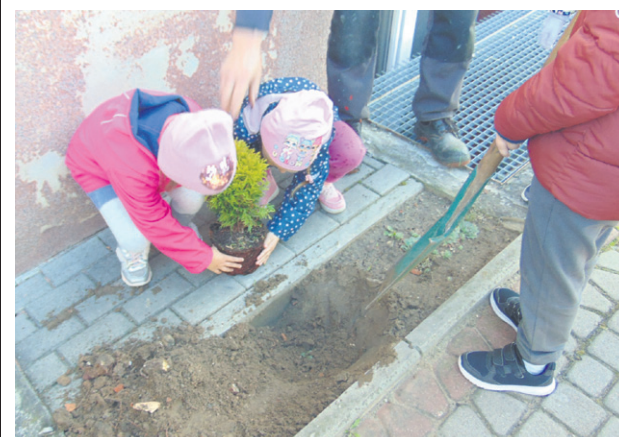
W akcji wzięło udział m.in. Miejskie Przedszkole nr 6