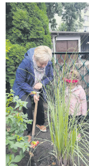
Żywa lekcja ekologii w Miejskim Przedszkolu nr 3