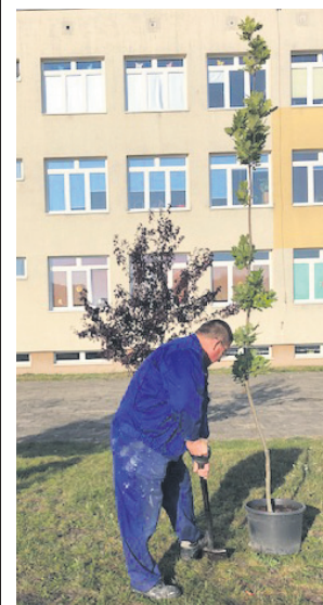
Pięć dębów trafiło na teren Szkoły Podstawowej nr 6