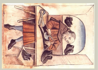
Szewc według średniowiecznej ryciny.

W 1521 roku w Sochaczewie działały już liczne bractwa cechowe: suknienny, ślusarsze, kowale, czapnicy, złotnicy, nożownicy, blacharze, miecznicy, munsztrkarze, siodlarze, pasnicy, kołodzieje, stelmachowie, bednarze, stolarze, rusznikarze,