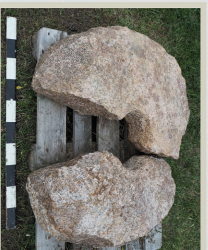
Kolo żarnowe odnalezione nad Bzurą podczas wykopalisk w 2018 roku.

W XIV w. Sochaczew pełnił już funkcję miasta, zaś podgródzie rozciągało się wzdłuż dwóch istotnych dla lokalnej społeczności punktów – zamku na wznórzcu, oraz kościoła farnego pod wezwaniem św. Wawrzynca na „Poświętmem” (przy dzisiejszej ulicy Staszica).