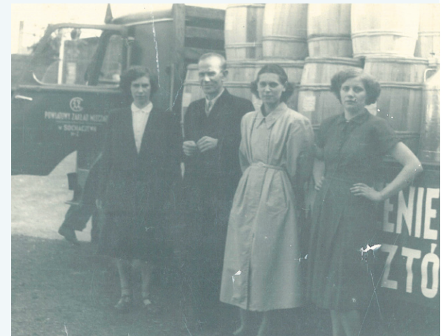
Beczki pełne masła. Mleko transportowano w metalowych, a masło trafiało do drewnianych beczek