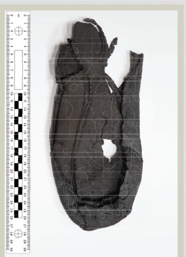
Fragment obuwia odnalezione podczas wykopalisk w 2019 roku.