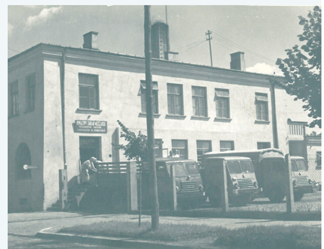
Zakład produkcyjny był na parterze, a nad nim mieszkania służbowe. Nad wejściem widnieje napis „Powiatowy Zakład Mleczarski. Przedsiębiorstwo Państwowe w Sochaczewie, ul. Traugutta 4”. Dziś z ulicy Traugutta widać tylko część budynku, gdyż resztę „wchłonął” Lidl

- Całe życie spędziłem za kierownicą. Szoferem byłem do 75 urodzin, pod koniec kursowałem na trasie z Hamburga do Astrachania nad Morzem Kaspijskim. To był piękny okres. Ponad 5 tysięcy kilometrów w jedną stro-