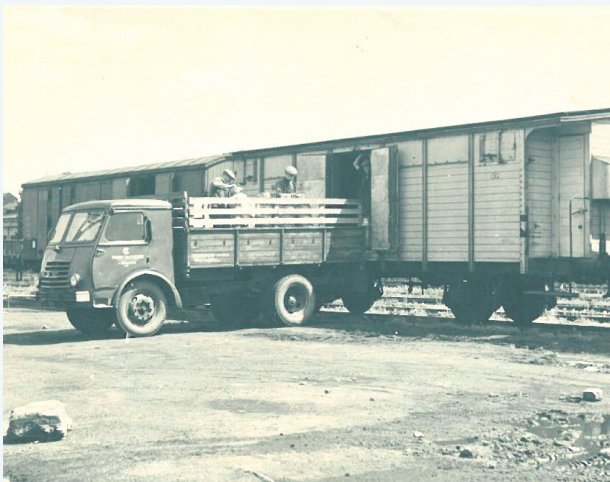
Nie wszystko, co wytworzyła mleczarnia, trafiało na lokalny rynek. Część produkcji wysyłano wagonami do klientów poza powiat. Wagon stoi na bocznicie kolejowej obok wieży ciśnień