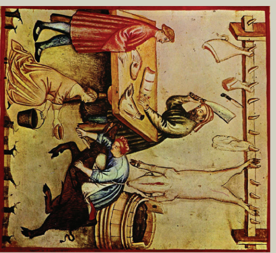
Praca rzeźników. Rycina średniowieczna.

Dokumenty wzmiankują, iż była ona wówczas siedzibą kasztelani, ośrodkiem Ziemi Sochaczewskiej, gdzie znajdował się tzw. kasztel, czyli gród o charakterze obronnym. W jego najbliższym sąsiedztwie wyrosła osada, zamieszkiwana przez ziemieśników i kupców, posiadająca także miejsce przeznaczone na targ. Wzniesiona na wznórzcu warownia pełniła między innymi funkcję tzw. refugium, czyli krótkotrwałego – z racji braku dostępu do wody – schronienia dla lokalnej ludności w razie najazdu.