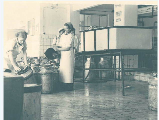
W Sochaczewie wytwarzano sery (dojrzewały w piwnicy), masło, mleko, śmietanę