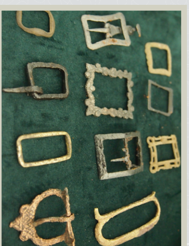
Sprzączki i klamry od butów odnalezione po północnej stronie od wzgórza zamkowego podczas prac w 2019 roku.

W 2019 roku odkryto, po północnej stronie wzgórza, zabudowę, będącą pozostałością prawdopodobnie warsztatu szewskiego z XV w. Wyrób butów wymagał bliskości bieżącej wody, zaś w tamtym okresie płynęła wzdłuż zamkowej góry niewielka