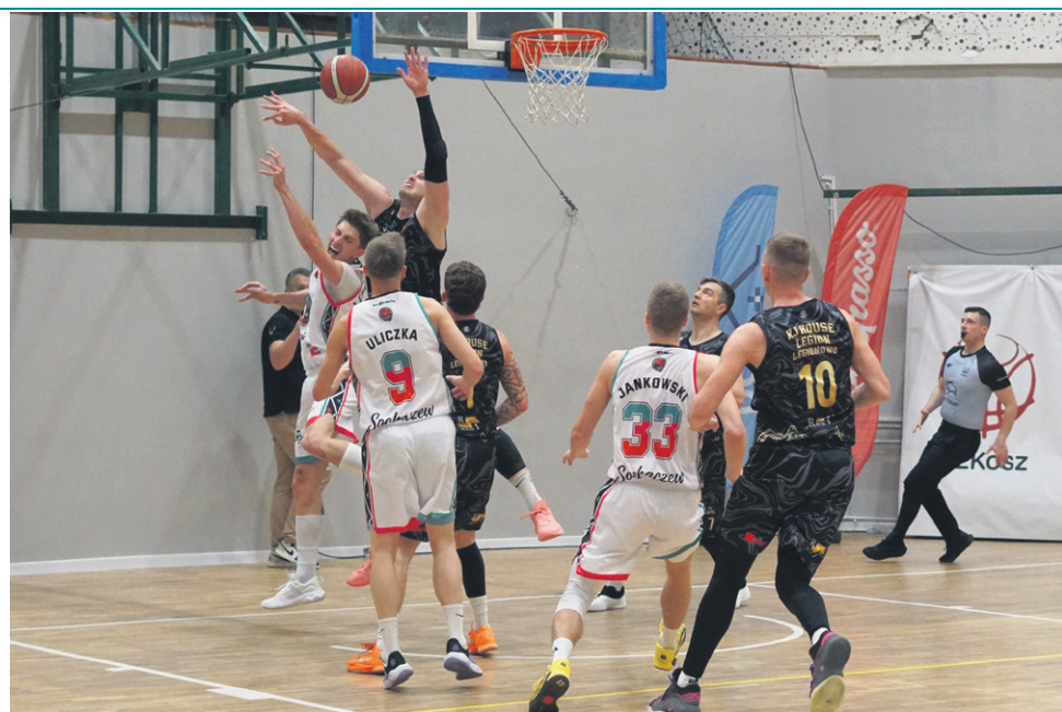
Rysie Sochaczew – RJ House Legion Legionowo 78:105 (21:27, 21:22, 17:28, 19:28)