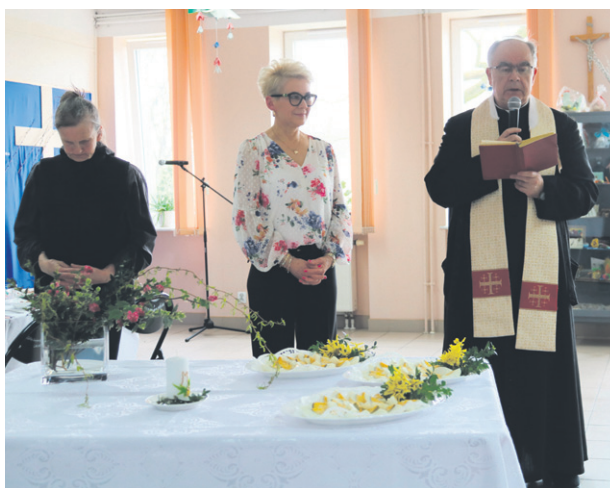
Wielkanocne spotkanie w Dziennym Domu Pomocy Społecznej

Tego samego dnia Miejskie Przedszkole nr 6 odwiedził wspaniały gość - Zajacek Wielkanocny, który przykicał z niespodziankami dla wszystkich przedszkolaków. Wchodząc do przedszkola zostawił koszyczek na placu zabaw i nagle wiatr rozsypał po całym terenie kolorowe jajeczka. Dzieci obiecały zajaczkowi pomoc i zaczęły się poszu-