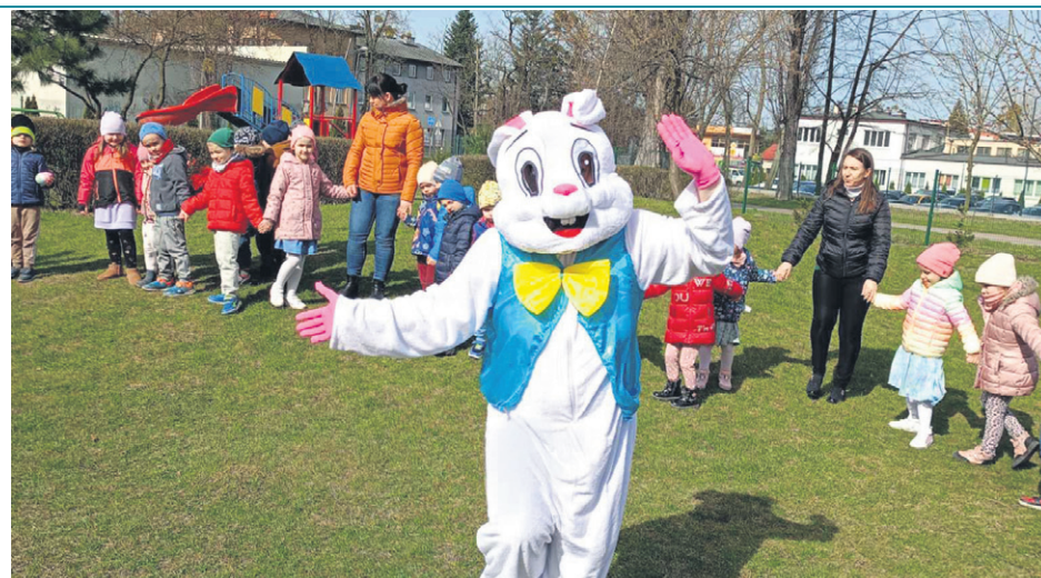
Wielkanocny zajacek przyniósł dużo radości przedszkolakom z MP6