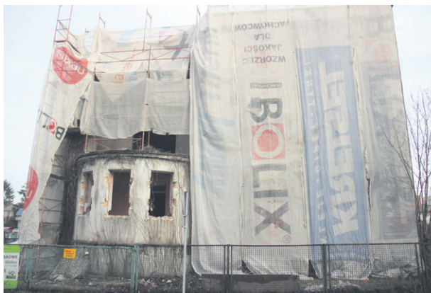
Fotografia wykonana 17 stycznia 2023 r., kiedy trwała rozbiórka kamienicy Szepietowskich

Kawałek dalej w stronę centrum, na wysokości ul. Farnej, od ówczesnej Trojanowskiej odchodziła ul. Kozia, która kończyła się tam, gdzie obecna Batore-