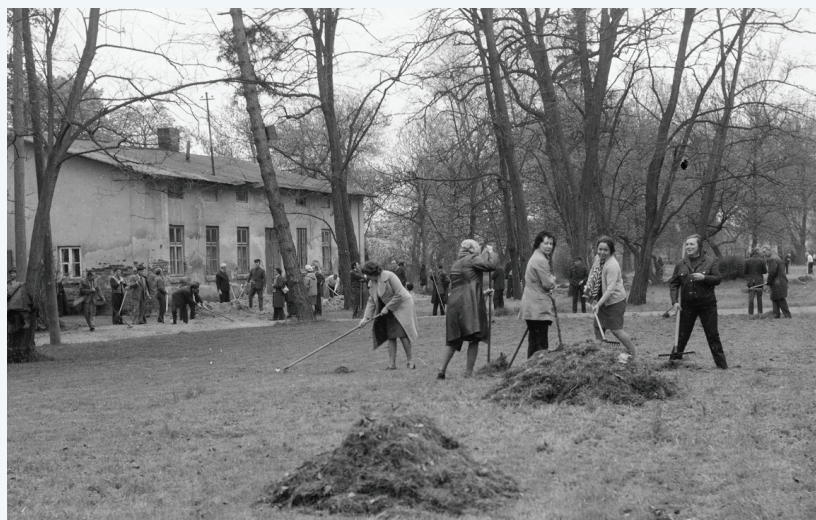
Sprzątanie parku Garbolewskiego - rok 1975. Na zdjęciu widzimy nieistniejący już budynek dla pałacowej służby.

Na większą skalę rozpowszechniły się w drugiej połowie lat 50. jako manifestacja poparcia dla rządzącej ekipy Władysława Gomułki. Swoje apogeum czyny osiągnęły natomiast w latach siedemdziesiątych. Wtedy to, na wezwanie