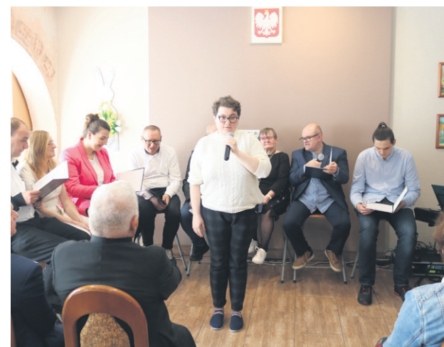
Uczestnicy ŚDS przygotowali pełen refleksyjny program artystyczny

ze znajomości najbardziej charakterystycznych budynków w mieście. Było też wspólne tworzenie pisanek. Powstało wiele pięknych świątecznych prac, a jedną z nich otrzymał burmistrz, za co zrewanżował się słod-