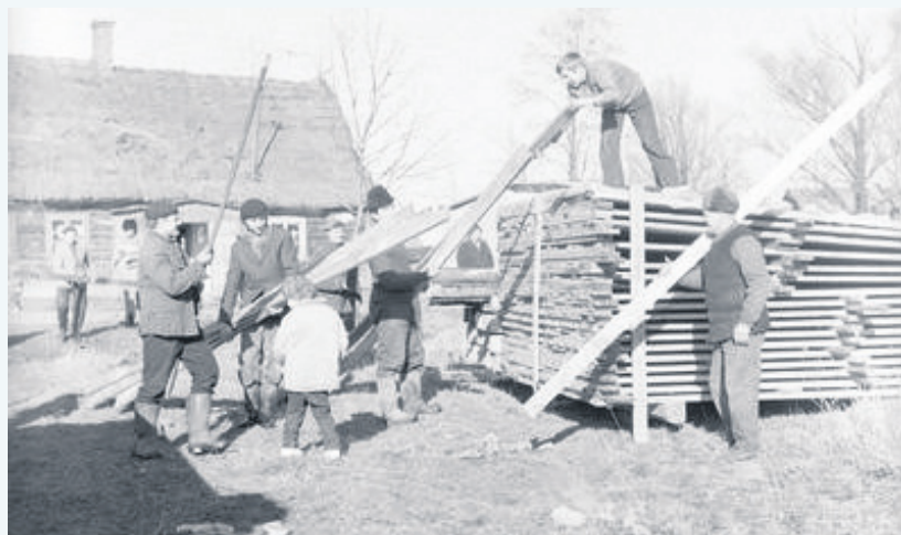
Budowa w czynie społecznym zlewni mleka w Matyldowie.

Edwarda Gierka, I sekretarza KC PZPR, swój czas wolny „spontanicznie” poświęcało już nie setki a miliony Polaków.