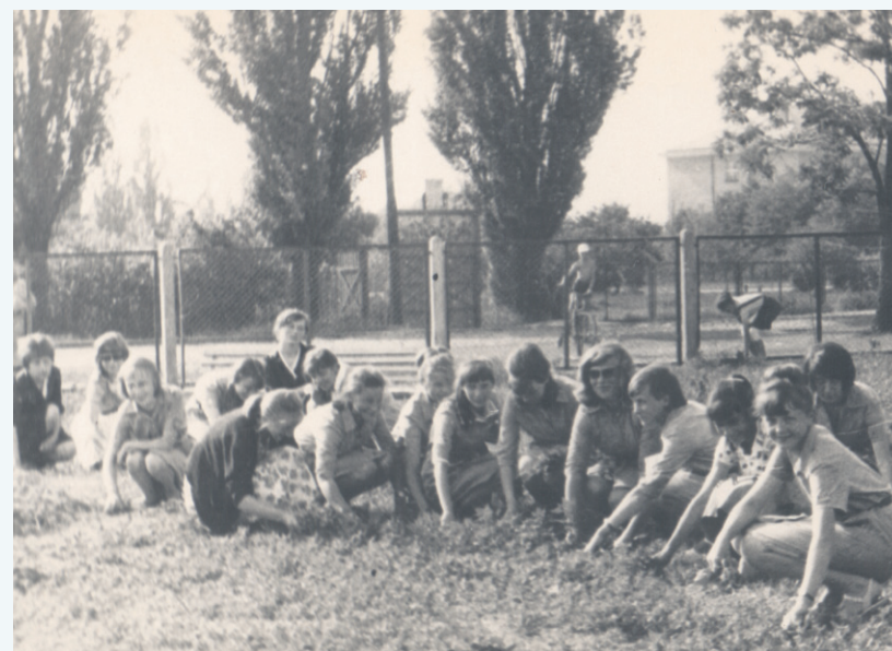
Uczniowie jednej z sochaczewskich szkół podczas czynu społecznego.