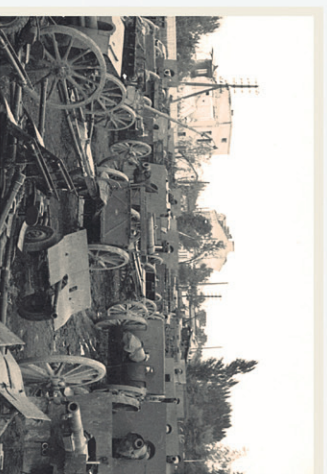
Na pierwszym planie armaty przeciwpancerne 37 mm, z prawej armata polowa 75 mm, a w głębi haubice 100 mm i ciężka armata 120 mm

Na zdjęciach widoczny jest praktycznie cały przekrój wyposażenia artyleryjskiego Wojska Polskiego. Odnajdujemy tu armaty przeciwpancerne Bofors 37 mm wz.1936, armaty przeciwlotnicze Bofors 40 mm wz.1936, armaty 75 mm wz.1902/26 i wz.1897, haubice 100 mm wz.1914/19. Ciężką artylerię reprezentują armaty dalekostronne 120 mm wz.1913 i 155 mm haubice wz.1917. Całości dopełniają przodki i jaszczki artyleryjskie oraz wozy taborowe, samochody osobowe i ciężarowe, ciągniki, amunicja artyleryjska i strzelecka.