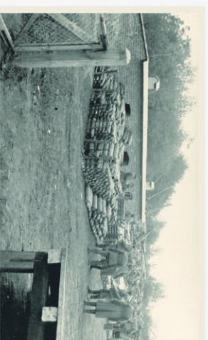
Sos amunicji artyleri i ciężkiej

Sochaczew miał bardzo dogodnie położenie by urządzić wielki skład zdobytych wojennej. Blisko było do miejsc największych walk, przechodziła przezeń ważna linia kolejowa Warszawa-Łowicz-Kutno, do której w Sochaczewie, specjalną bocznicą doprowadzona była powiatowa kolej wąskotorowa sięgająca poprzez Puszczyę Kampinoską aż do Wyszogrodu. Jeszcze dziś w rejonie kolejowej wieży ciśnień zobaczyć można pozostałości rampy łączącej stację P.K.P ze stacją kolejki.