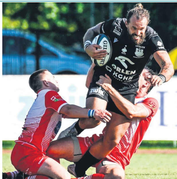
Sponsor tytularny RC Orkan: ORLEN S.A.; Sponsor strategiczny: Miasto Sochaczew; Sponsorzy generalni: Gardenia Sport, Poltrans Sochaczew; Sponsorzy główni: HBRS, Fast Service, VFM Real Estate, G-Shock, Zibi-Casio, InterFresh, Murapol. Sponsorzy: Aljeka, Żywiec Zdrój, Carrefour, Drukarnia Chrzczony, SochBud, Cukiernia Lukrecja, Kawecik-Transport. Główny partner medialny RC Orkan: Radio Sochaczew i TuSochaczew.pl

- W Wielką Sobotę super ważny mecz naszej drużyny. W tabeli zajmujemy obecnie trzecie miejsce, Ogniwo jest drugie. To