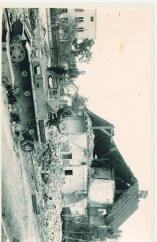
Rozstrzelany przez polską artylerię niemiecki PzKpfwIV na ulicy Sochaczewa – przed ściganiem na składowisko

W 1939 roku służyła jako punkt obserwacyjny, po zdjęciu dachu planowano utworzyć na niej również stanowisko obrony przeciwlotniczej. Nie udało się tego zamysłu zrealizować, zaś po przegranej wojnie obronnej okolice stacji stały się swoistym „cmentarzyskiem wrzesnia”.