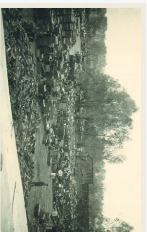
Tysiące skrzyń z amunicją artyleryjską i strzelecką

Obszerny plac koło wieży ciśnień doskonale nadawał się na składowisko, a linia kolejowa umożliwiała wywieżenie do Rzeszy sprzętu jeszcze przydatnego Wehrmachtowi i złomu do niemieckich hut.