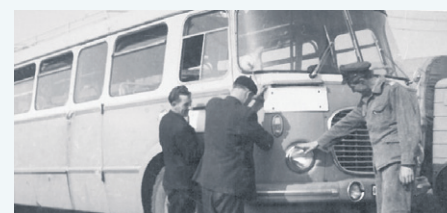
Pracownicy REDP podczas przeglądu „ogórka”, czyli autobusu jecz 043