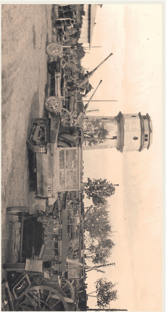
W środku kadru ciągnik artyleryjski C2P, a za nim armaty przeciwlotnicze 40 mm Bofors

Na zdjęciach widoczny jest praktycznie cały przekrój wyposażenia artyleryjskiego Wojska Polskiego. Odnajdujemy tu armaty przeciwpancerne Bofors 37 mm wz.1936, armaty przeciwlotnicze Bofors 40 mm wz.1936, armaty 75 mm wz.1902/26 i wz.1897, haubice 100 mm wz.1914/19. Ciężką artylerię reprezentują armaty dalekostronne 120 mm wz.1913 i 155 mm haubice wz.1917. Całości dopełniają przodki i jaszczki artyleryjskie oraz wozy taborowe, samochody osobowe i ciężarowe, ciągniki, amunicja artyleryjska i strzelecka.