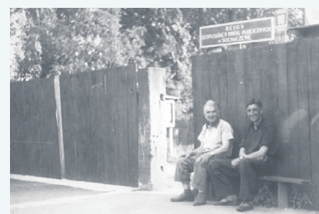
Pracownicy REDP przed bramą wjazdową na teren bazy przy ulicy Licealnej, początek lat sześćdziesiątych XX wieku

Miejski w Sochaczewie, a zdjęcie zostało wykonane od strony ulicy Grabskiego (dawniej ul. Świerczewskiego). Zdjęcia mają wymiar historyczny nie tylko dlatego, że przedstawiają zapomnianą historię Rejonu Eksploatacji Dróg Publicznych w Sochaczewie. Widzimy na nich również legendarne amerykańskie ciężarówki studebaker, które woziły zaopatrzenie dla wojsk alianckich, Armii Czerwonej oraz Wojska Polskiego podczas II wojny światowej, a po jej zakończeniu trafiły m.in. do REDP w Sochaczewie. Na jednej z fotografii widzimy również stara 21 oraz legendarnego „ogórka”, czyli jecz 043.