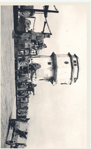
Polskie armaty przeciwlotnicze 40 mm załadowane na platformy - przygotowane do wywieżenia do Rzeszy

Projekt realizowano w bardzo wielu miastach, bliźniacze wieże, bądź poddane niewielkim modyfikacjom odnaleźć można w Żyrardowie, Nasielsku, Pławie, Radomsku czy Kominię. Sochaczewski obiekt nazywany bywa również przez mieszkańców „wodokaczką”.