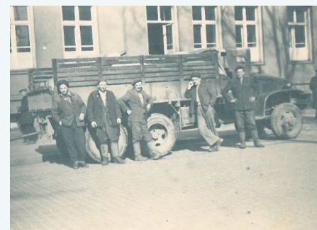
Pracownicy Rejonu Eksploatacji Dróg Publicznych przed budynkiem Urzędu Miejskiego w Sochaczewie, początek lat sześćdziesiątych XX wieku