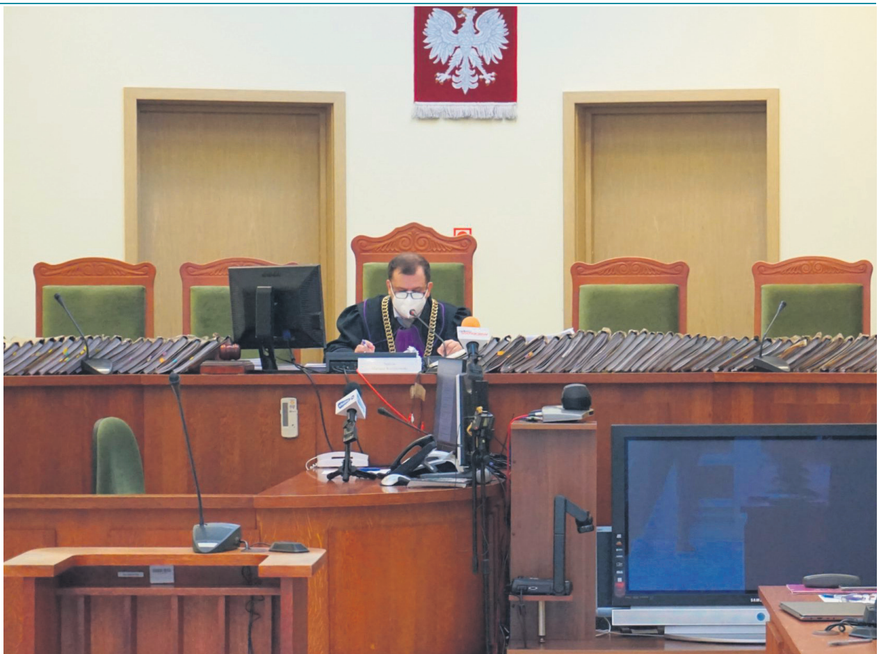
Plocki sąd nie miał wątpliwości co do winy osób oskarżonych w aferze DPS

- Chciałam bardzo serdecznie wszystkich prze-