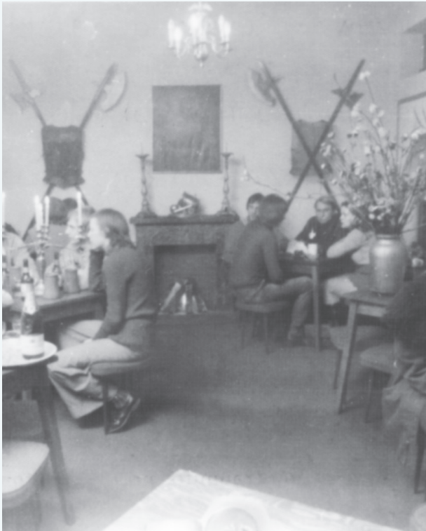
Kawiarnia „Rycerska” - lata 70. ubiegłego wieku.

Mówiąc o kawiarniach funkcjonujących w Sochaczewie nie można zapomnieć o „Rycerskiej” - mieszczącej się w budynku piekarni państwa Gzików, o „Piekiełku” czy „Stokrotce” na rogu ulic Warszawskiej i Poprzecznej. Ta ostatnia nie funkcjonowała jednak długo - została zniszczona w wyniku pożaru.