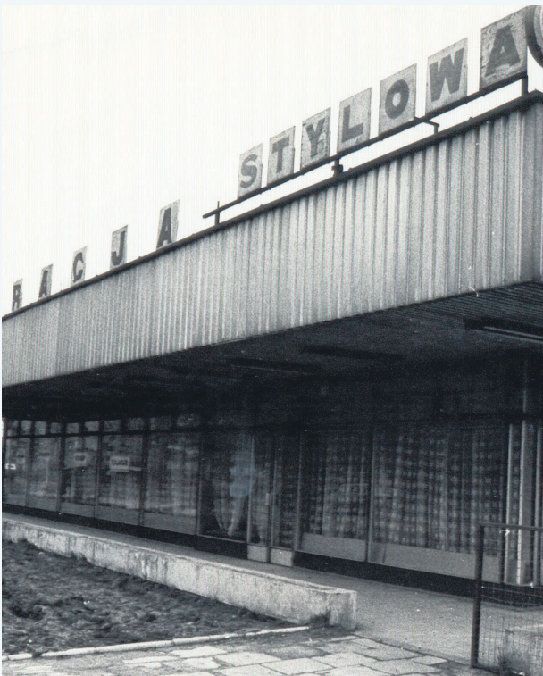
Restauracja „Stylowa” - lata 90. ubiegłego wieku.