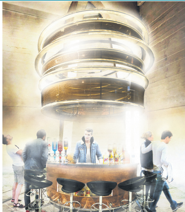
Ostatnia kondygnacja, a na niej bar z podświetlanym, metalowym żyrandolem, nawiązującym do pojemnika na wodę

W 2016 roku na łamach „ZS” Maciej Frankowski pisał – koncepcja projektu dotycząca sochaczewskiej wieży zakłada stworzenie zintegrowanego punktu komunikacyjno-turystycznego, mającego na celu zwiększenie atrakcyjności miasta, ale też rozwój turystyki rowerowej oraz promocję kolei wąskotorowej prowadzącej do Kampinoskiego Parku Narodowego. W skład kompleksu miałyby wejść przejście podziemne łączące peron stacji kolejowej