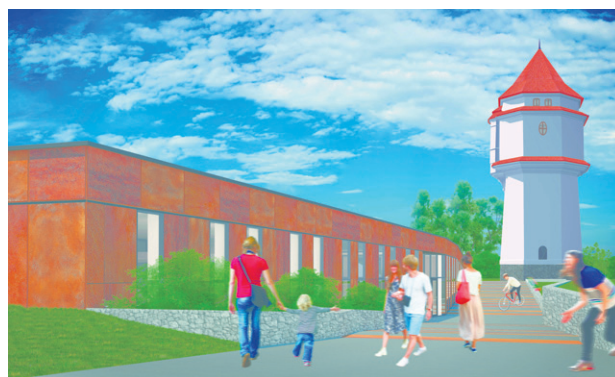
Do wieży ciśnień można dojść przejściem podziemnym łączącym peron stacji kolejowej z projektowanym kompleksem. W jego skład wchodzi pawilon przeznaczony pod usługi, handel i gastronomię, a także wypożyczalnia rowerów i parking rowerowy

z wieżą ciśnień. Przy wyjściu z podziemi znajdowałyby się sekcja przeznaczona pod usługi, handel i gastronomię, a także wypożyczalnię rowerów i parking rowerowy.