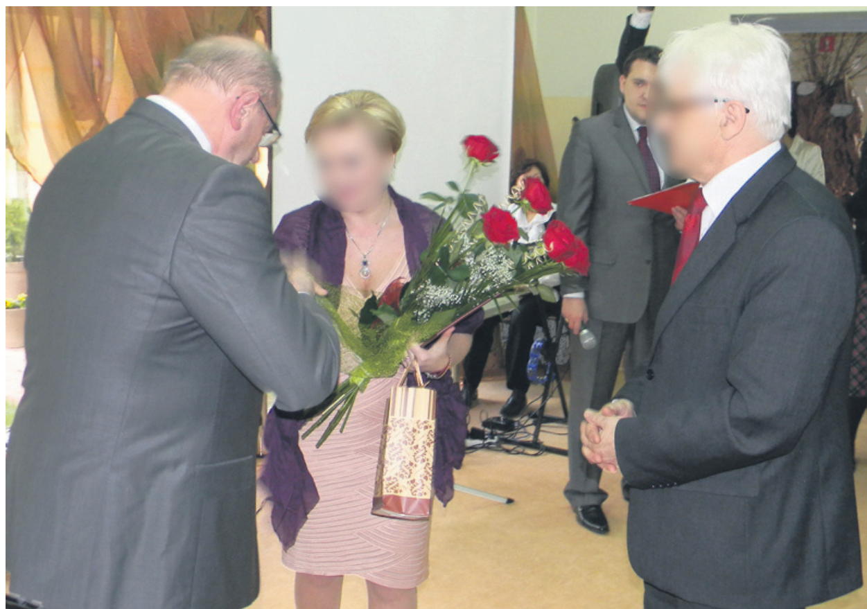
Była dyrektor DPS w towarzystwie starostów IV kadencji Rady Powiatu Sochaczewskiego