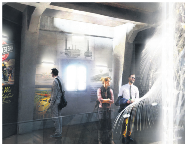
Pierwsza kondygnacja z antresolą i przestrzenią wystawową, gdzie np. można przypomnieć historię kolejnictwa w Sochaczewie