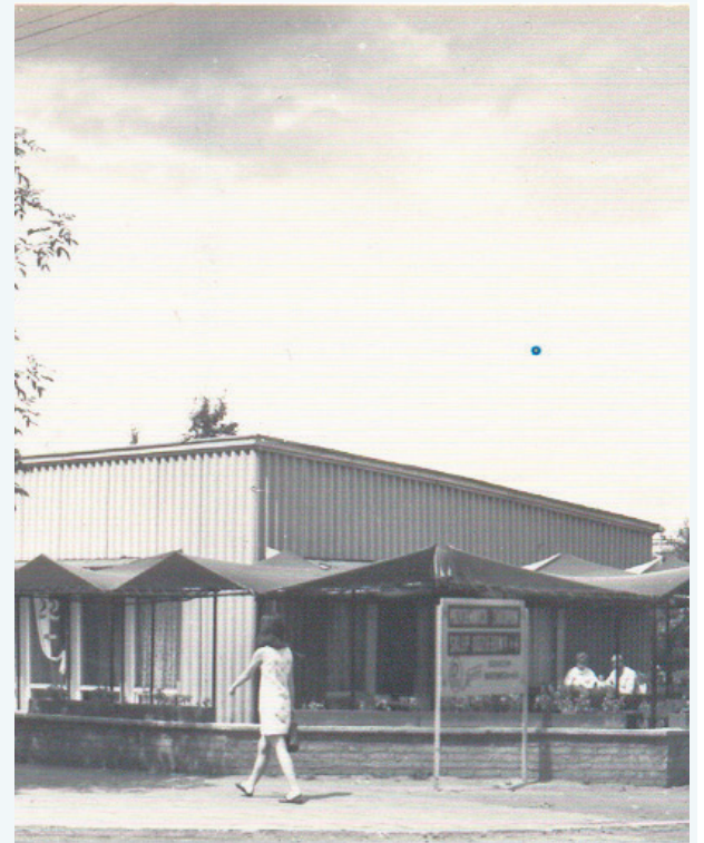
Restauracja „Stokrotka” – lata 60. ubiegłego wieku.