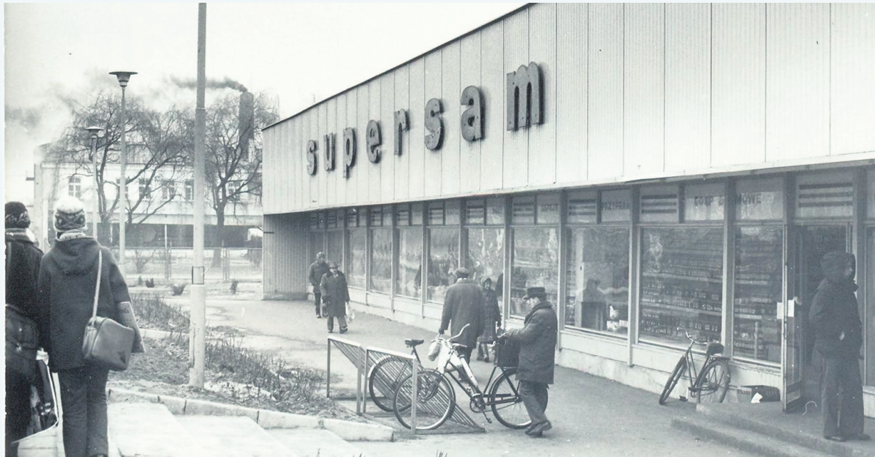
Supersam przy ulicy Traugutta, koniec lat 70. ubiegłego wieku. Obecnie w tym miejscu stoi hotel Chopin.

Prawdą jest natomiast to, że wieczorem, przed pożarem, do sklepu przywieziono dużą dostawę towaru, w tym alkohol i kozuchy. Natomiast pożar wybuchł nad ranem następnego dnia. Według relacji świadków był tak intensywny, że przybyli na miejsce sochaczewscy strażacy nie mogli go ugasić. Dziwnym trafem spadło również ciśnienie wody w sieci wodociągowej a hydrantów było jak na lekarstwo. Dlatego wezwano na pomoc okolicznych druhów ochotników, w tym strażaków z Niepokalanowa. Ci ostatni zaczęli ciągnąć wodę z Bzury, jednak niewiele to dało i Sam całkowicie spłonął, wraz ze znajdującym się w nim towarem.