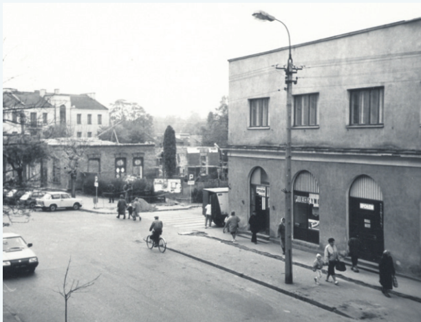
Kramnice miejskie, to w nich mieścił się sochaczewski sąd. Na zdjęciu wykonanym na początku lat 90. ubiegłego wieku uwieczniono Dom Chleba funkcjonujący wówczas w kramnicach a na dalszym planie przebudowę dawnego Powiatowego Domu Kultury na siedzibę banku PKO SA