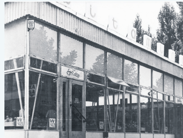
Pawilon owocowo-warzywny przy ulicy Warszawskiej (obecnie pl. św. Dominika), 1967 rok. Obiekt spłonął w 1968 roku.