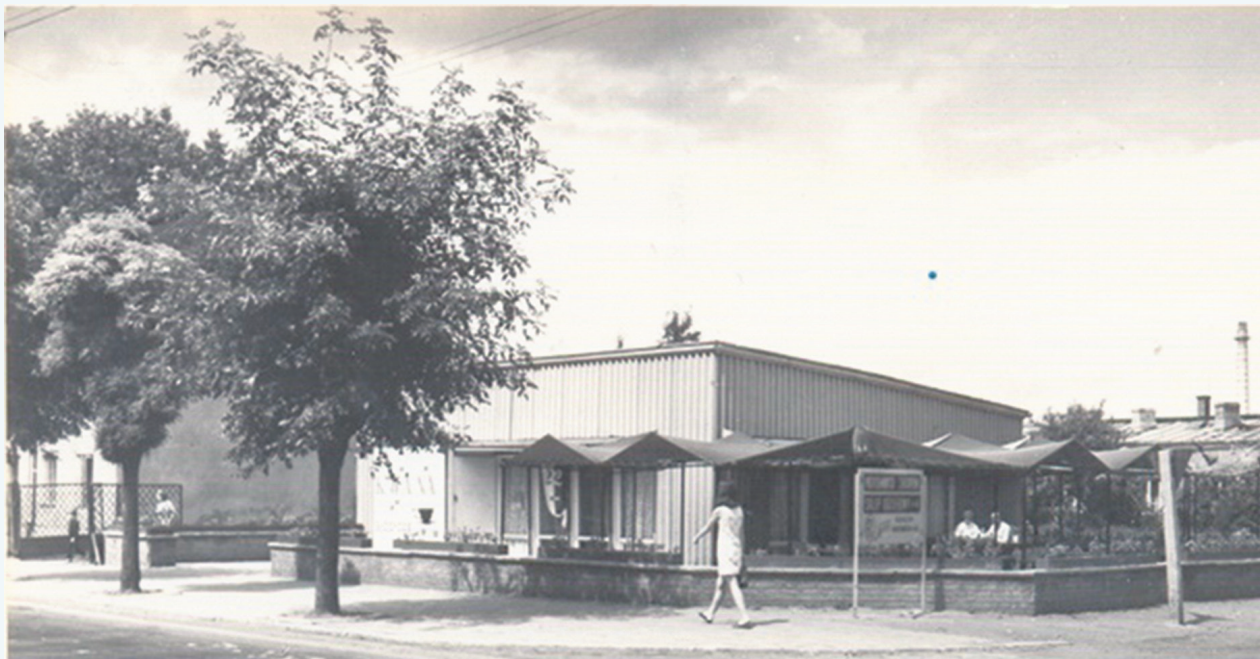
Jedno z niewielu zachowanych zdjęć kawiarni Stokrotka, wykonane w połowie lat 60. ubiegłego wieku.