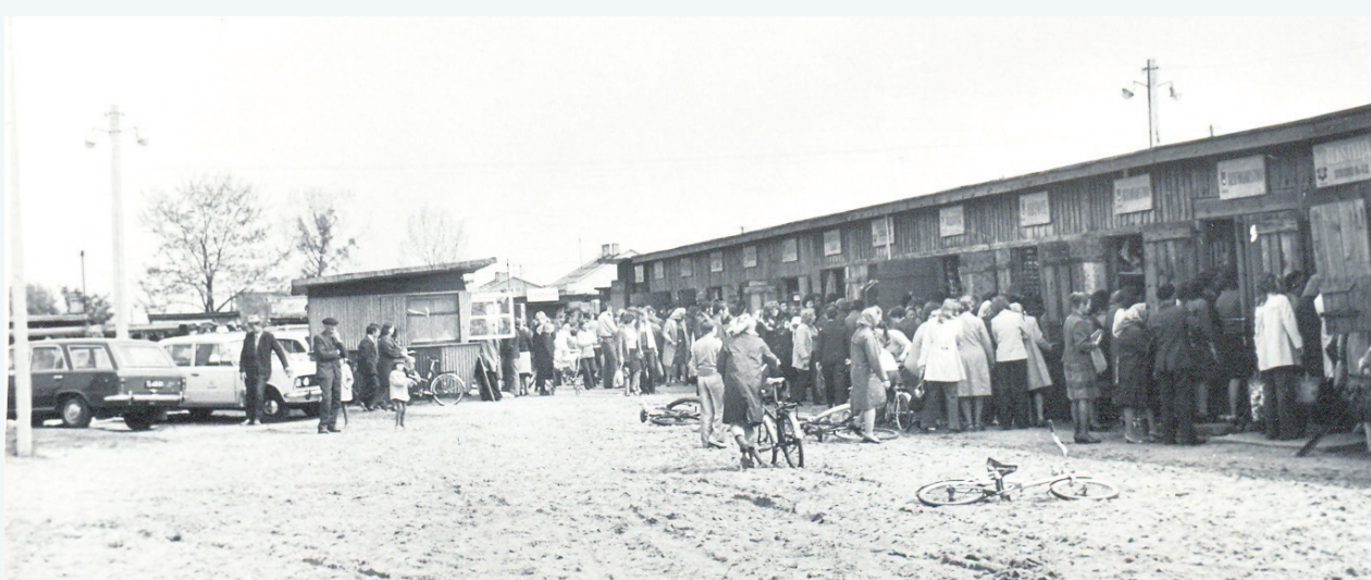
Targowisko przy ulicy Targowej w Trojanowie, połowa lat 70. ubiegłego wieku. W tamtym okresie największe centrum handlowe w ówczesnym województwie skierniewickim.