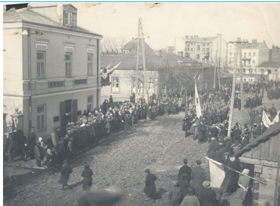
Manifestacja patriotyczna w Sochaczewie prawdopodobnie z okazji Święta Niepodległości. Lata 30 XX w. (ze zb. MZSiPnB. 3084*MZS)

Sytuacja uległa zmianie po przewrocie majowym, gdy ówczesny premier Józef Piłsudski wydał 8 listopada 1926 r. okólnik skierowany do ministrów. Napisał w nim, że „w