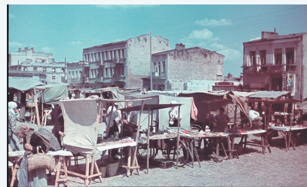
Handel na placu Kościuszki, czerwiec 1940 roku. Zdjęcie zostało wykonane przez Wilhelma Brauera , niemieckiego korespondenta wojennego. Ciekawostką jest nie tylko sam kolor. W górnym lewym rogu uwieczniono arkadowy budynek, w którym mieściła się apteka, a za nim dwie kamienice przylegające kiedyś do domu państwa Janiszewskich przy skrzyżowaniu Staszica z Toruńską . Zdjęcie z archiwum rodziny Brauer

W tym odcinku cyklu „Kocham moją ulicę” zapraszamy na wędrówkę śladami miejskiego targowiska. A to, co rusz, zmieniał swoją lokalizację, aby w końcu zawędrować na ulicę Pokoju .