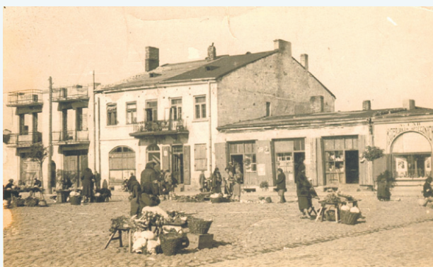
Targowisko na placu Kościuszki, okres II wojny światowej. Zdjęcie przedstawia handel na tle północnej pierzei rynku i wykonano je prawdopodobnie w 1942 roku, po likwidacji sochaczewskiego getta.