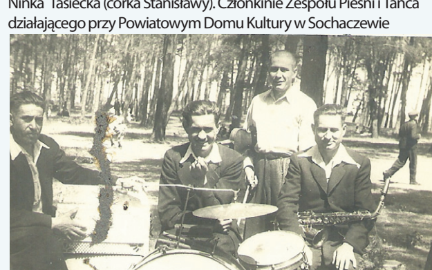
Zespół Klusków podczas potańcówki w Gawłowie, roku 1939