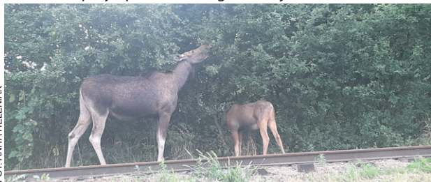
Przy torach wąskotorówki przerwa na małe jedzenie