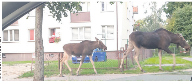
Tu rodzina przyłapaną na ul. Ogrodowej