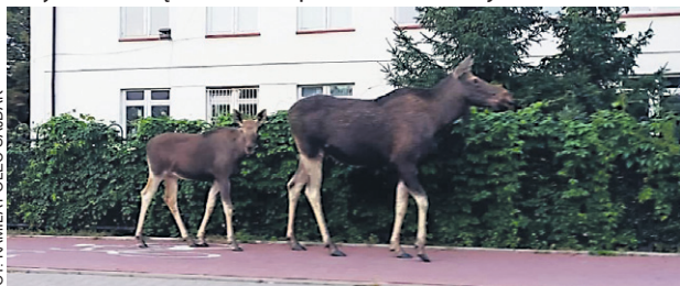
Spacer przy Szkole Podstawowej nr 7