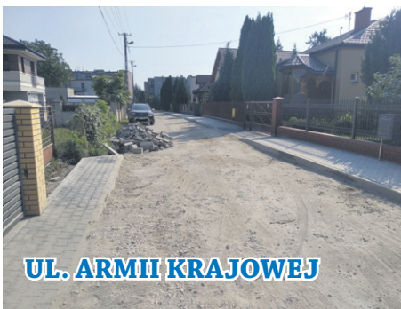
UL. ARMII KRAJOWEJ

Dotychczas prowadzono prace na nieutwardzonych asfalcem ulicach. W przypadku ul. Kwiatowej sfrezowano starą nawierzchnię. Docelowo pojawi się na niej nowa ścieralna warstwa bitumiczna. Podobne roboty