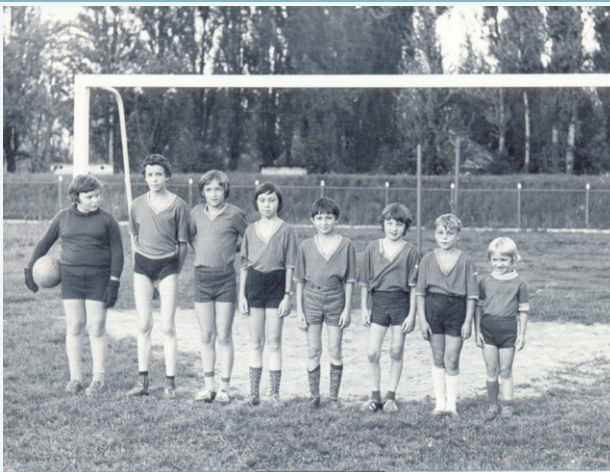
Drużyna osiedlowa, Chodaków, lata 60. ubiegłego wieku.